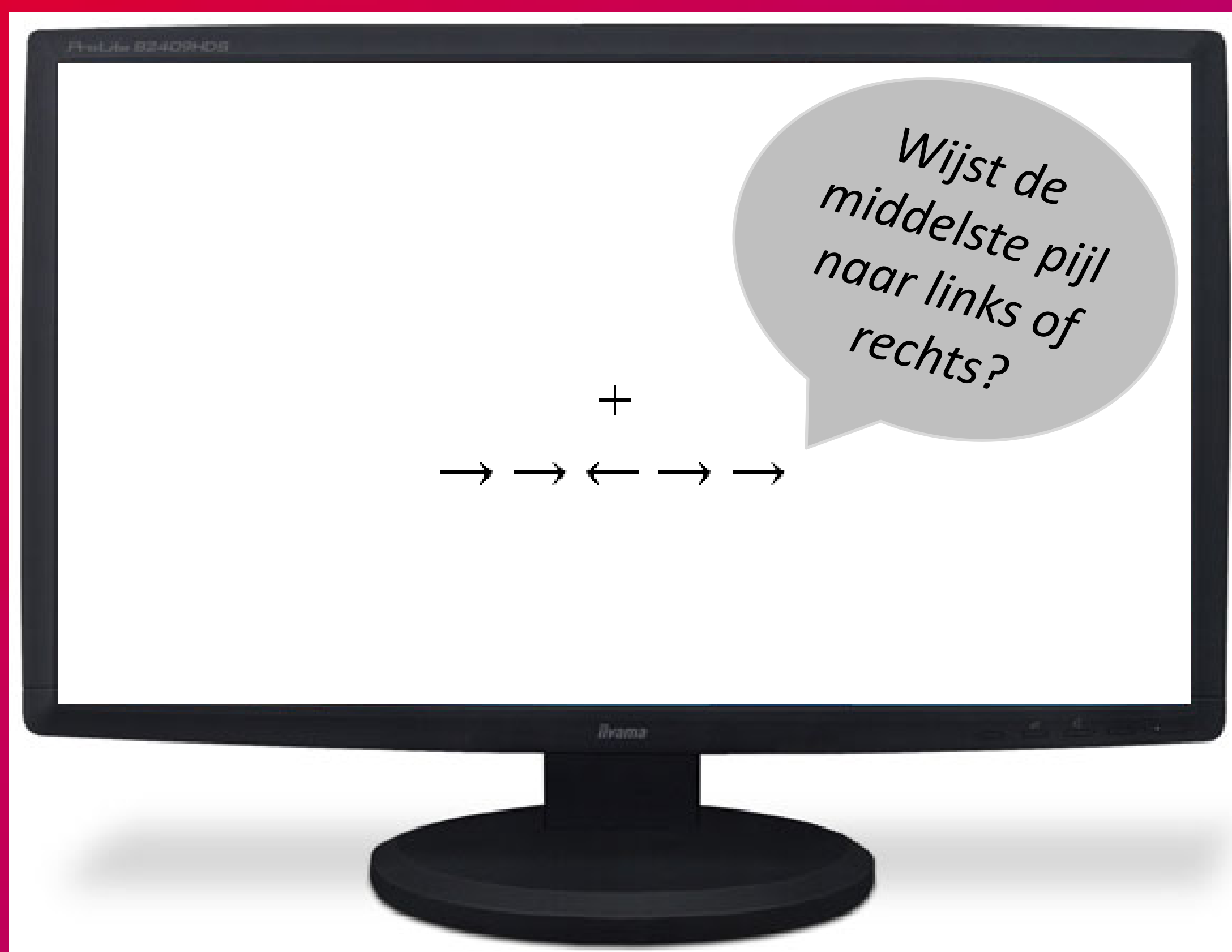
Figuur 1. Voorbeeld van een incongruente ANT trial

(2) Deze relatie is sterker bij vrouwen met een beperkt vermogen om weerstand te bieden aan de belonende eigenschappen van eten (oftewel zwakke executieve controle).