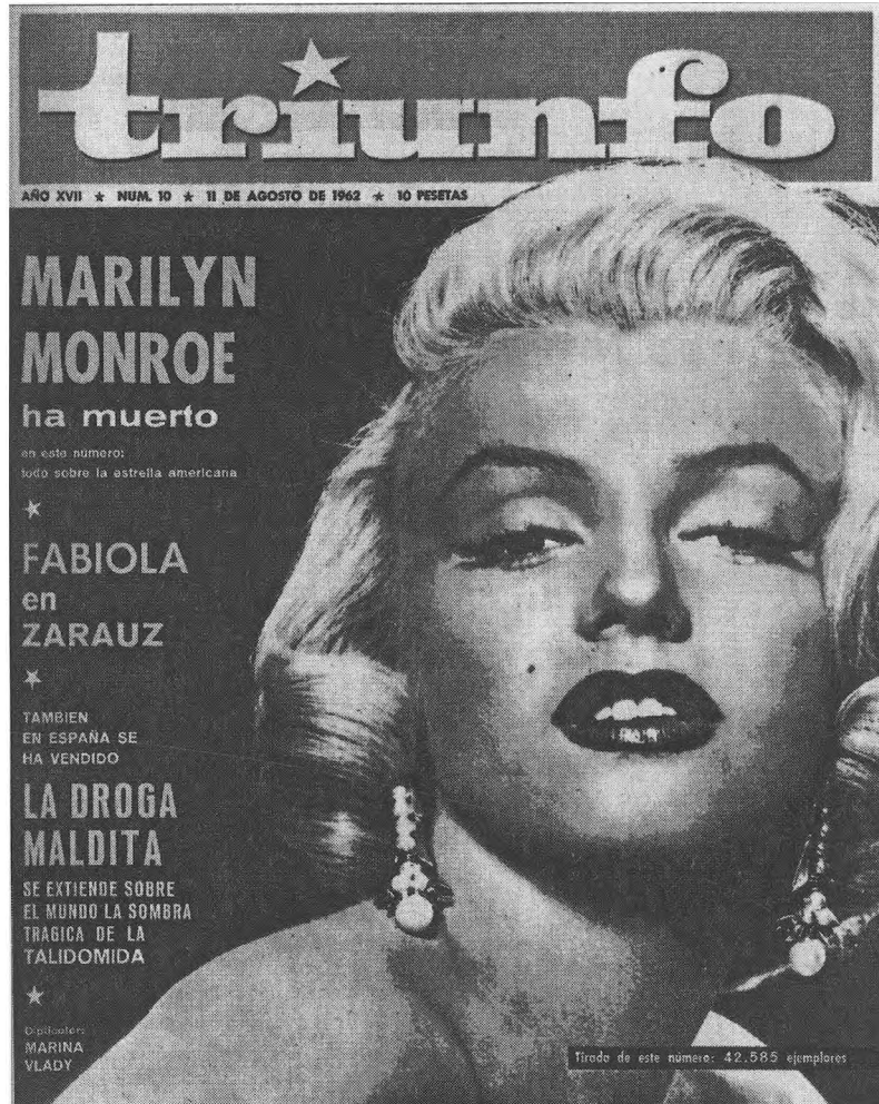
Triunfo XVII nr 10 (11 augustus 1962).