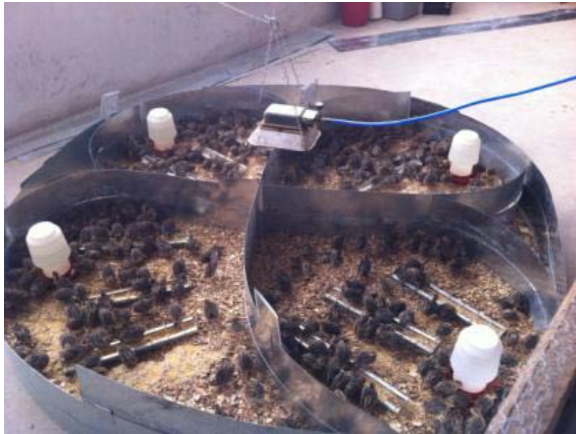
Ilustración 5 El experimento en la segunda semana

Para la formulación y elaboración del alimento, se analizaron los requerimientos básicos de nutrientes para las aves y así se formuló la dosificación exacta para las seis semanas que duró el estudio referido. A la sexta semana las codornices están listas para consumir alimento de ponedoras.