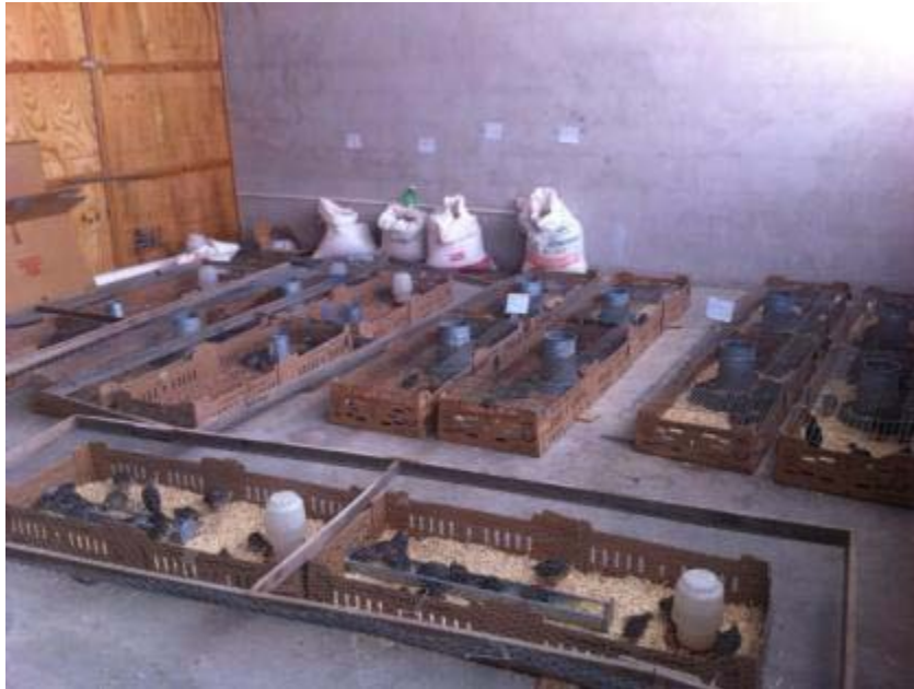
Tratamientos en el diseño experimental DBCA, con cuatro repeticiones