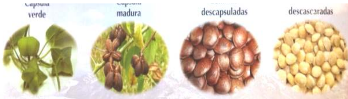
Ilustración 1 La semilla, del cultivo a la industria

Fases de la semilla del Sacha Inchi: Maduración / secado en planta / peladas / descascaradas