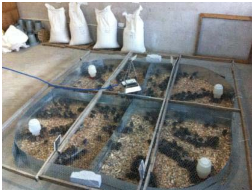
Ilustración 6 Tratamientos con cubierta anti-vuelo para la tercera semana