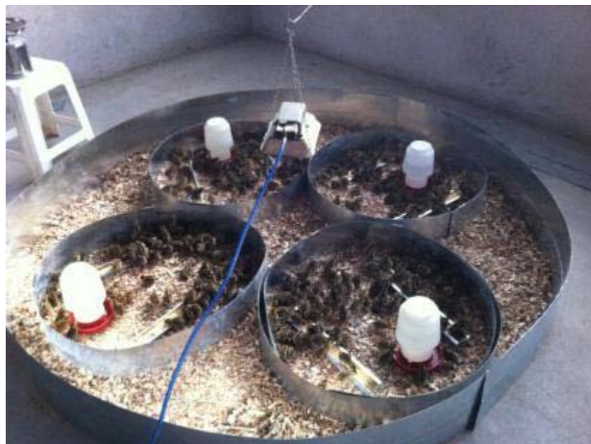
Separación de tratamientos compuestos por cien aves de 4 días de nacidas