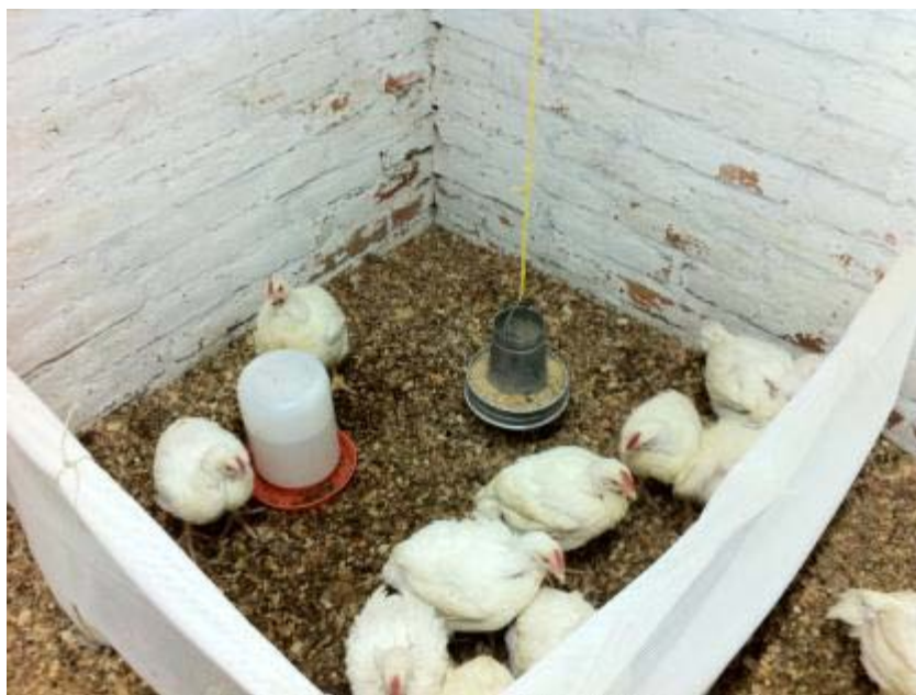
Jaula con diez pollos por tratamiento

Para la formulación y elaboración del alimento, se siguió el Programa de Alimentación para pollos de engorde de Proaves (filial de Pronaca). Se tomó como referencia la tabla 6 de dicho