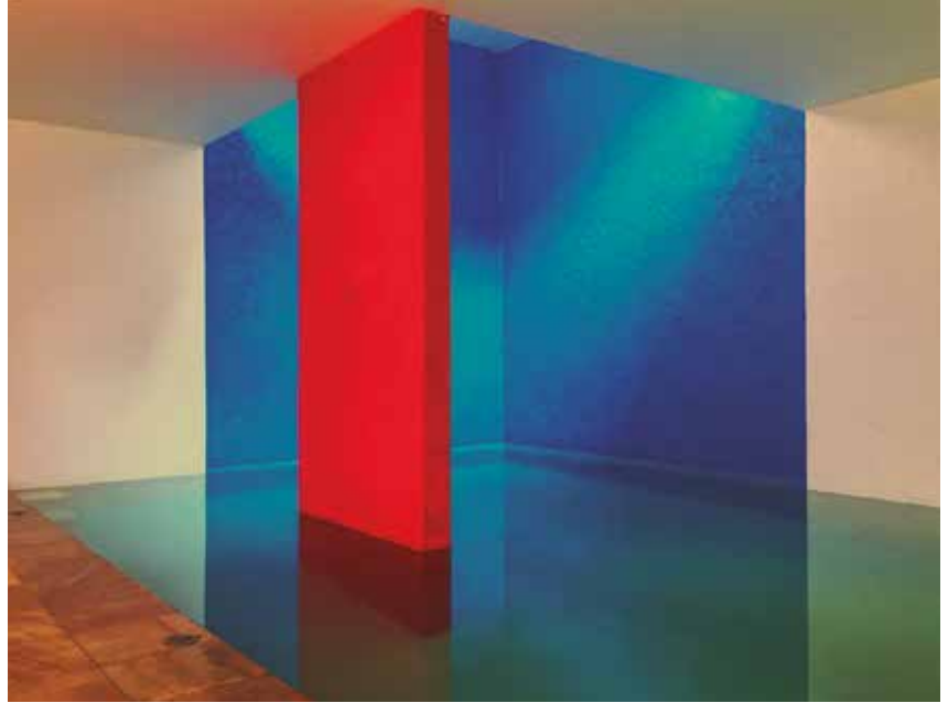
Imagen 2. "Obra del Arquitecto Luis Barragán. Casa Gilardi". Por: Fausto Aguirre, 2016.

cubierto por un color que resalte su volumen y le otorgue preponderancia, fortaleciéndolo cromáticamente y, por tanto, generar atracción hacia él.