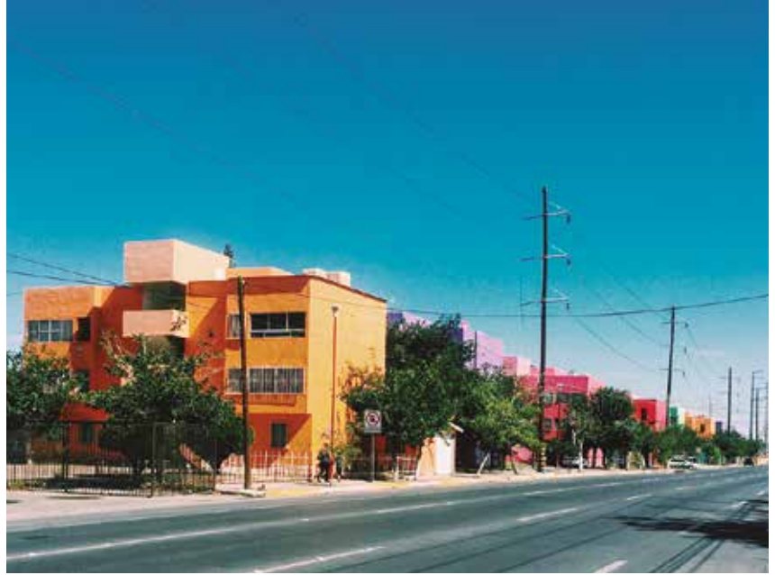
Imagen 4. "Fovissste Chamizal. Área intervenida". Por: Fausto Aguirre, 2015.

Una vez realizada la intervención cromática, la apariencia del lugar generó un espacio más dinámico, mejoró el estado visual de los edificios y su contexto, e impactó de forma positiva a las familias del sector. La paleta cromática que se empleó en este lugar provocó una composición armónica en el complejo habitacional, dotó al espacio de un ambiente festivo y de integración (elementos característicos de la cultura mexicana) e influyó en el estado anímico del espectador, además de rescatar la estética del sector evitando que la arquitectura tuviera una imagen obsoleta. Todo esto como resultado del valor estético y funcional que genera el color, a lo que también le podemos nombrar como experiencia cromática física y sensorial 10 .