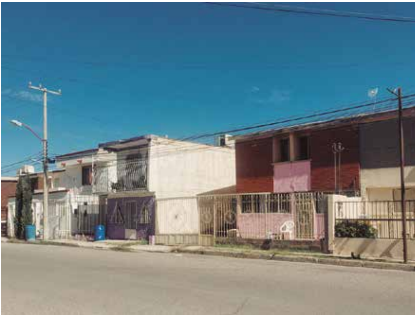
Imagen 3. “Fovissste Chamizal. Área sin intervenir”. Por: Fausto Aguirre, 2015.

(SEDATU), junto con otros funcionarios de la localidad, desarrollaron un proyecto con la iniciativa de rescatar y remozar 600 viviendas de la unidad habitacional Fovissste Chamizal —esta unidad está compuesta por 100 módulos de viviendas y cada uno de ellos cuenta con 3 niveles, construidos en el año 1989—. Una de las mejoras realizadas a algunos de los módulos residenciales fue la de revestir las fachadas y accesos de éstos por medio de colores de aspecto brillante y cálido, con el fin de un mejoramiento físico de los edificios y del entorno, ya que presentaban una imagen de deterioro que afectaba de manera negativa la vida social (dentro de las familias y con sus vecinos) y patrimonial de los residentes, poniéndolos en condiciones de inseguridad y desintegración familiar. “El espacio no es una suerte de espectador de actividades: es un factor influyentísimo y puede tener un papel determinante en el ánimo de la gente que está dentro de él” (González, 2014, p. 71).