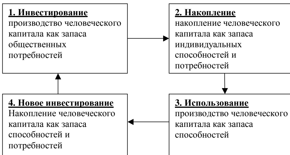
Рисунок 2. Модель воспроизводственного оборота индивидуального человеческого капитала

Рассмотренный механизм можно представить в виде следующей схемы, изображенной на рисунке 2: