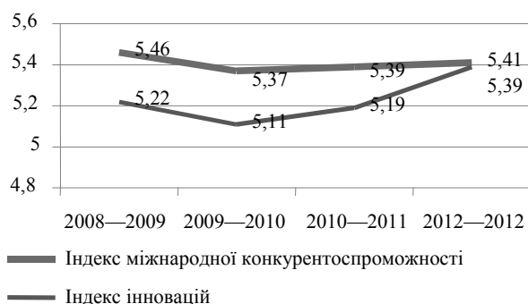
Рис. 1. Динаміка індексів міжнародної конкурентоспроможності та індексу інновацій