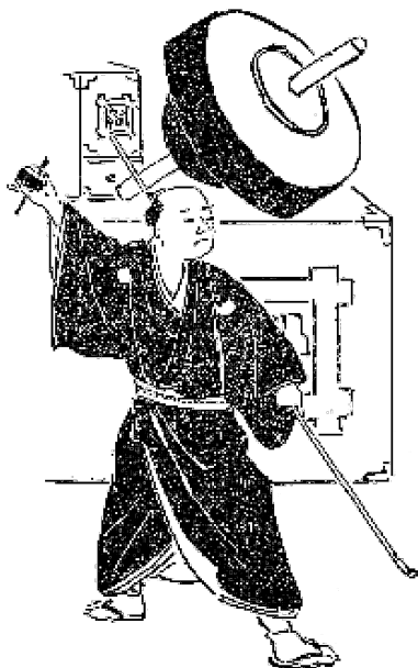
宮尾しげを他「江戸庶民街芸風俗誌」より

金輪作り物：「金輪遣い 21) 」と思われる。つなぎ目のない金輪五、六個を、かけ声と共に通して何かの形を作る。