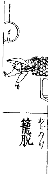
「和漢三才図説」卷十六より

カラクリ物を演じる（人形浄瑠璃については後述）。このように日本の伝統的な庶民芸に加え、長崎からのいわゆる舶来物の目新しい曲芸などを織り交ぜながら、実に多彩な芸能が上演されている。そこには日本文化を外国使臣へ紹介しようなどといった格式ばった雰囲気はなく、国書奉呈を終えた一行の緊張感をほぐすための、遊び感覚としての趣向が凝らされている。