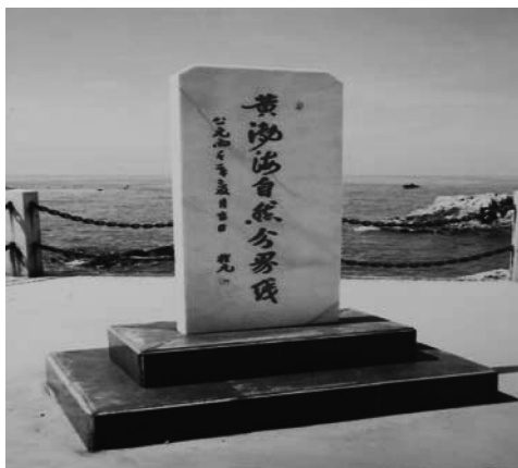
写真3 黄海・渤海境界線の石碑