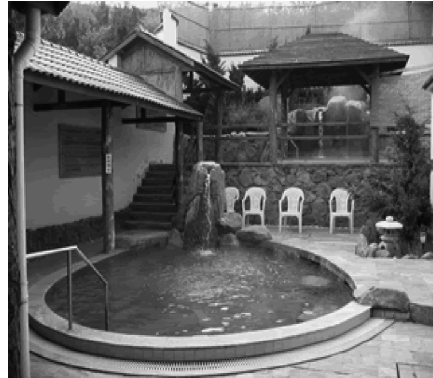
写真6 老鉄山露天風呂

謝 2009: 45]。観光客の多くは半日で旅順を観光した後に、すぐ大連に戻って宿泊するのが一般的であった。旅順が観光客に与える印象を改善しなければ、観光客が二度と足を運ぶことはない。こうした危機意識の下、旅順と組になる気分転換の場として老鉄山温泉が誕生した。老鉄山温泉の社会的文化的な意味は単なる観光の手段としての温泉施設の場を遥かに越えていた。