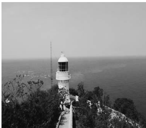
写真4 老鉄山百年灯台

をひきつけている。老鉄山の西南側が海に没する所は遼東半島南側の最先端で、「黄海・渤海境界線」の石碑（写真3）が立ち、黄海と渤海が融合している。この景観は「黄海不黄、渤海不藍」と言われ、黄海は黄色くなく、渤海は碧くはないという珍しい景観になっている。空は青いの、海を眺めると、少しぼんやりしていても、黄海と渤海の境界線ははっきりと見える。左側は黄海、右側は渤海である。風の日になると色が入り混じる。この絶景の描写には「一山観二海」（一つの山に二つの海が見える）という表現が使われる。