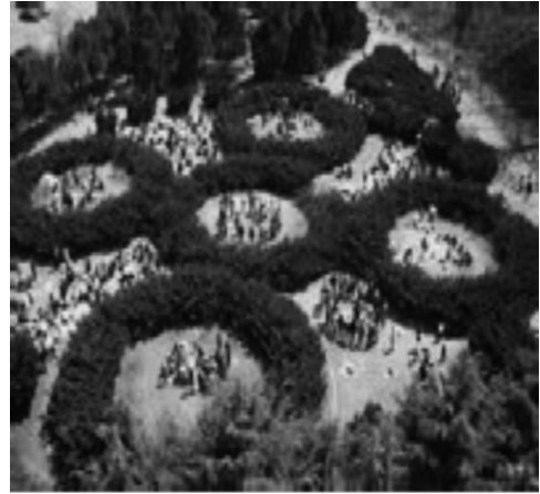
写真2 龍王塘のオリンピック五輪の造型