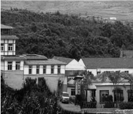
写真5 老鉄山温泉全体風景