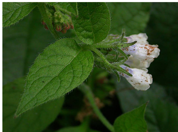
Abb. 8: Symphytum ×hidcotense, Teverener Heide, Kreis Heinsberg/NRW (21.05.2006,).