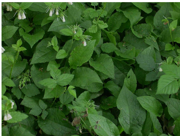
Abb. 7: Symphytum ×hidcotense, Teverener Heide, Kreis Heinsberg/NRW (21.05.2006,).