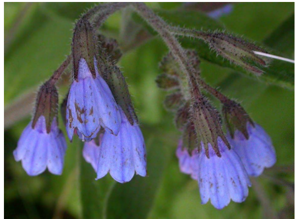
Abb. 4: Blüten von Symphytum caucasicum, bei Steckenborn, Städteregion Aachen/NRW (27.05.2009,).