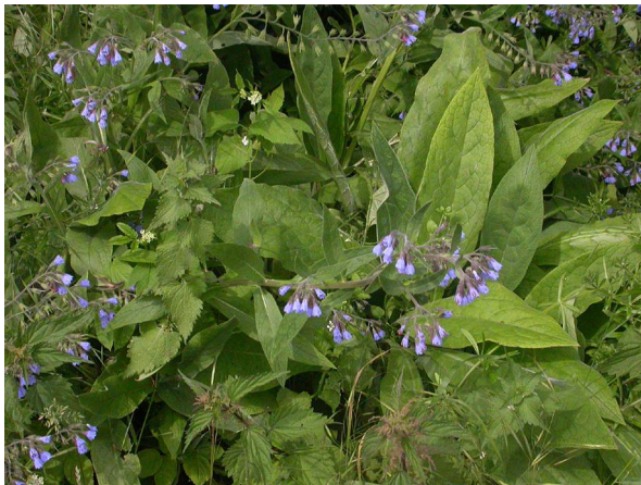
Abb. 3: Symphytum caucasicum an einem halboffenen Waldwegrand bei Steckenborn, Städteregion Aachen/NRW (27.05.2009,).