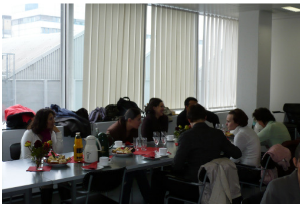
Begrüßungs-Kaffeetrinken der LL.M.-Studierenden am 26. Oktober 2007 im Dekanat

Im Weiterbildungsstudiengang Law and Finance studieren im Jahrgang 2007/2008 40 Teilnehmerinnen und Teilnehmer, die aus 27 verschiedenen Ländern kommen.