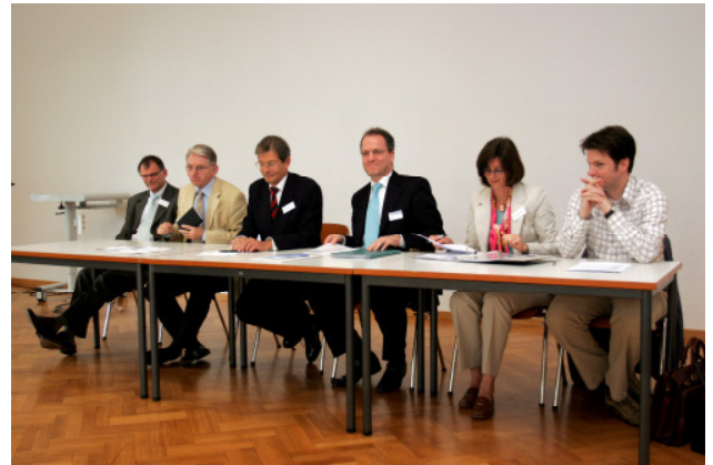
Der Vorstand bei der Mitgliederversammlung 2007