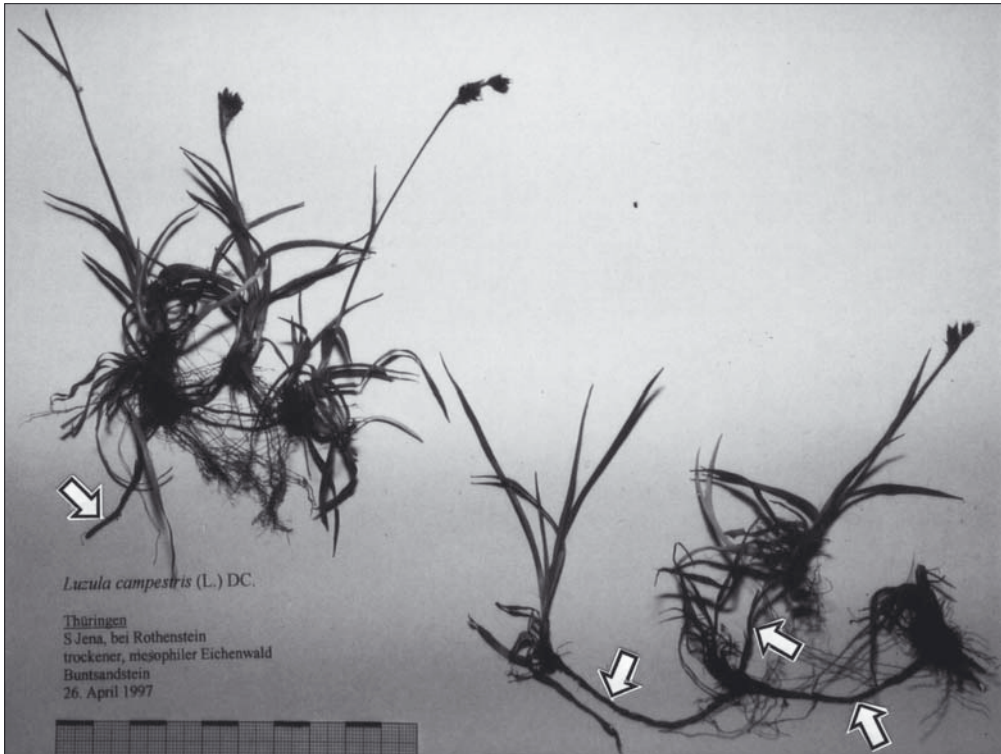
Abb. 4: Habitus von Luzula campestris (L.) DC. bei Jena. April 1997. Die Pfeile markieren die mehrere cm langen Ausläufer.

L. multiflora und L. congesta können - wie oben erwähnt - habituell L. divulgata ähneln, sind aber durch das Antheren-Filament-Verhältnis von \pm 1:1 (bis in Ausnahmen 2:1), den deutlich länglichen, nie kugeligen Samenkörper sowie in der Blütezeit (frühestens Anfang Mai bis Juli) von L. divulgata getrennt.