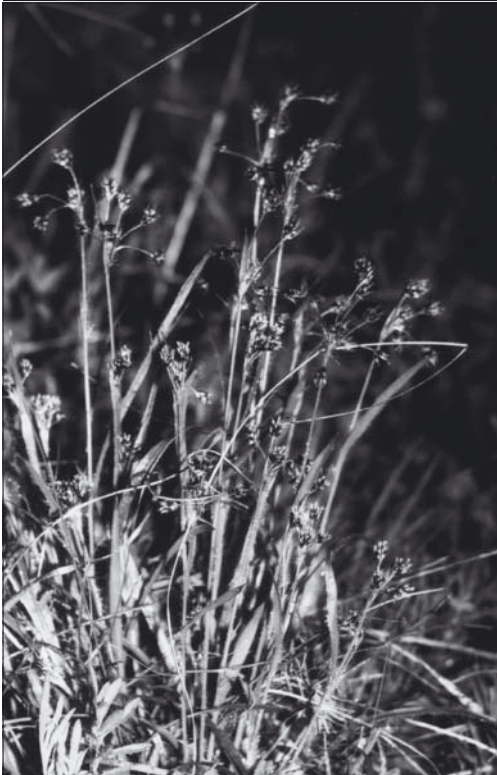
Abb. 1-4: Fotos S. DREYER, April 1997.

Sowohl L. campestris als auch L. divulgata blühen zeitig im Frühjahr , von März bis Ende April.