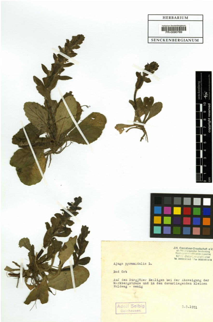
Abbildung 2: Herbarbeleg des Senckenberg-Herbariums von Ajuga pyramidalis aus dem Spessart.