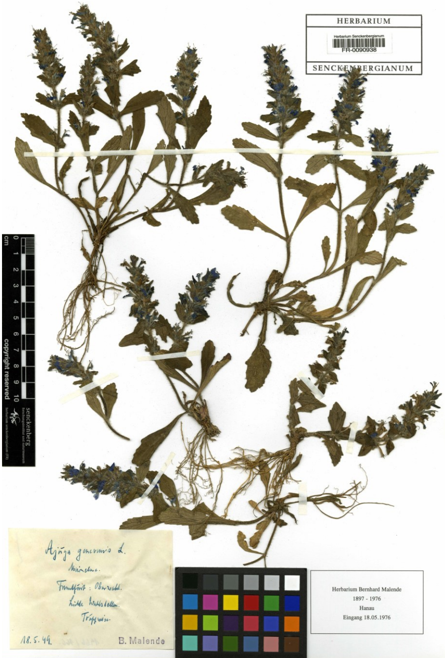
Abbildung 3: Herbarbeleg des Senckenberg-Herbariums von Ajuga genevensis aus dem Frankfurter Stadtwald.