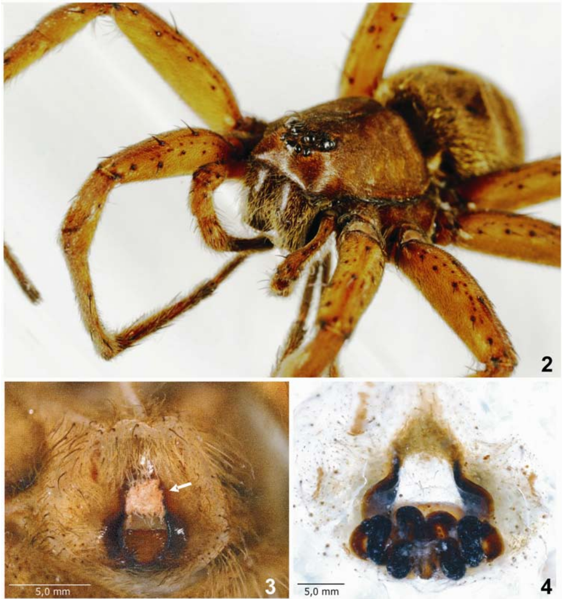
Abbs. 2-4: Dolomedes plantarius (Clerck, 1757), Weibchen aus Heidesee, Brandenburg, Neufund (ZMB 33161): (2) Habitus, Prolateralsicht, (3) Epigyne, ventral; (4) Vulva, dorsal; Pfeil siehe Text.