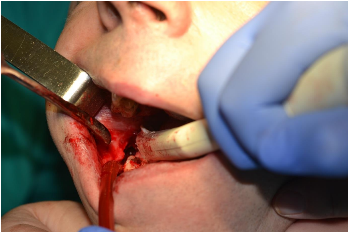
Rycina 2. Odwarstwiony płat śluzówkowo okostnowy