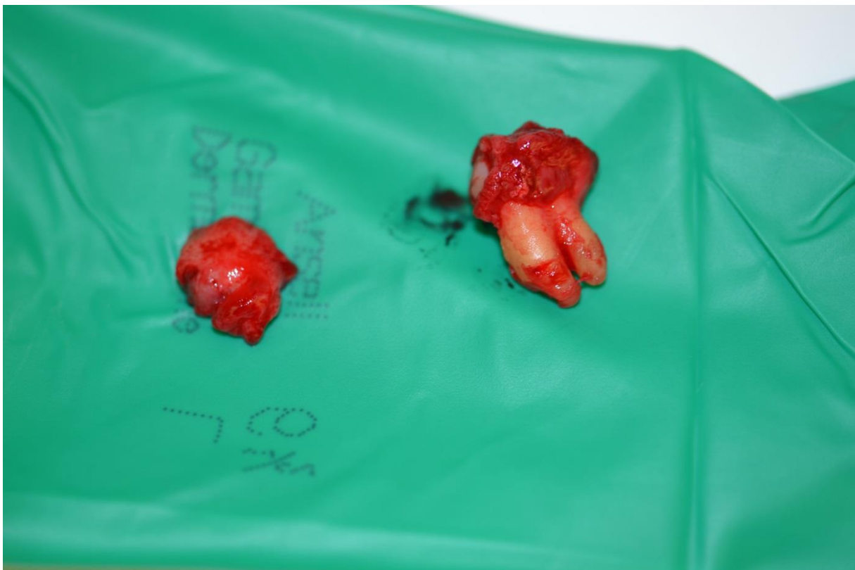
Rycina 3. Usunięty ząb 48 wraz z torbielowatą zmianą