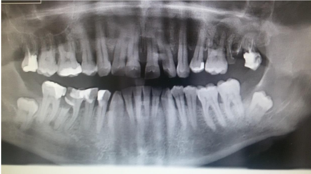
Rycina 1. Na zdjęciu pantomograficznym widoczne symetrycznie usytuowane torbiele w okolicy zatrzymanych zębów 38 i 48