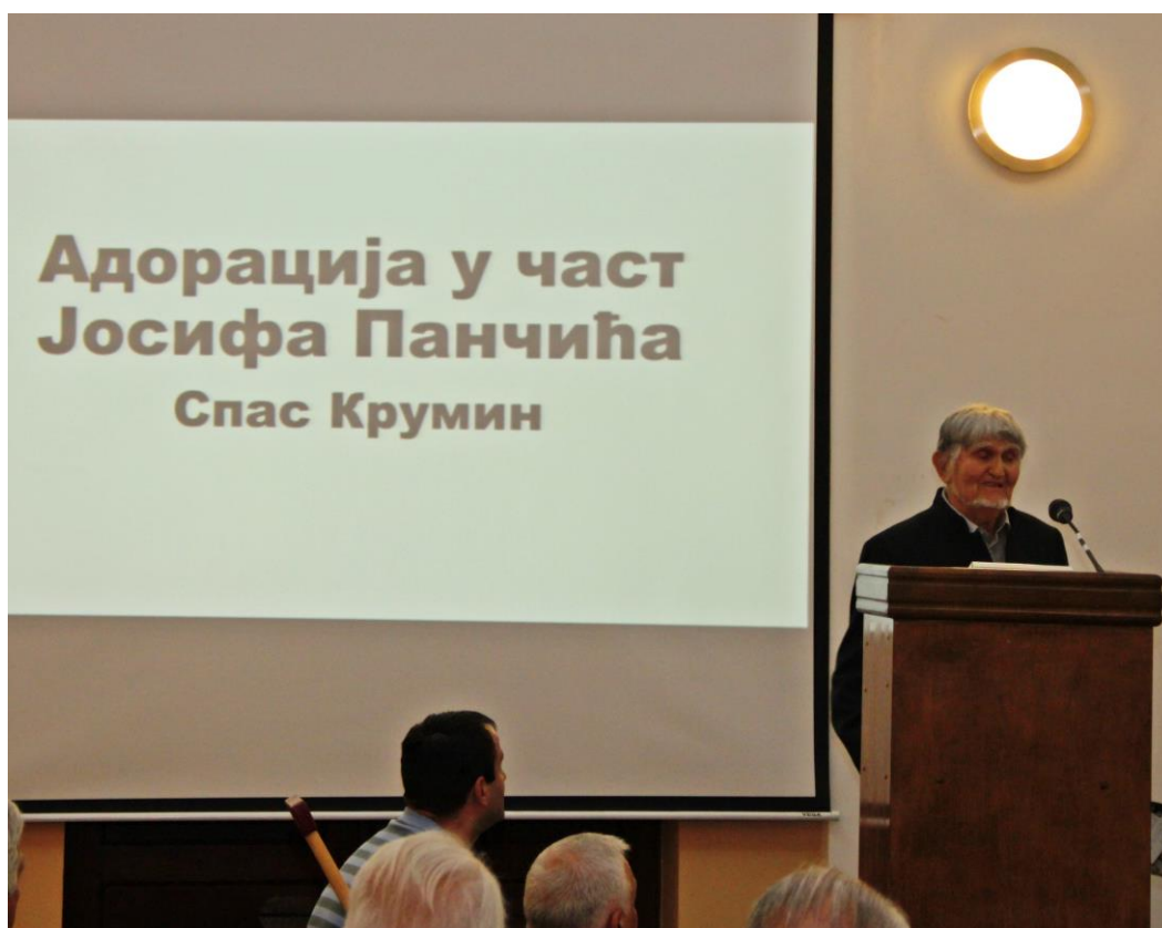
Fig. 1. The last lecture at the University of Niš