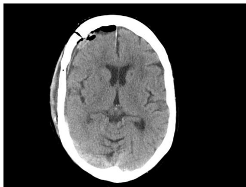
Fig. 3. Stan po reoperacji: śladowa ilość krwi przymózgowo w okolicy operowanej

Stan pacjentki po zabiegu początkowo znacząco się poprawił. Nawiązywała prosty kontakt słowny, miała dyskretny niedowład przeciwstronny oraz spełniała polecenia. Kontrolne badanie TK głowy wykonane dnia następnego uwidocznilo obecność powietrza wewnątrzczaszkowo w prawej okolicy czołowej, zmiany obrzękowe prawej półkuli mózgu, krew nadtwardówkowo po stronie operowanej oraz znaczące przesunięcie struktur linii pośrodkowej mózgowia. Nagłe pojawienie się bezdechów i pogorszenie kontaktu słownego w godzinach wieczornych następnego dnia po operacji spowodowało zakwalifikowanie jej na podstawie protokołu konieczności do rewizji okolicy operowanej w trybie natychmiastowym. Otwarto powłoki czaszki w okolicy operowanej, zdjęto płat kraniotomijny oraz usunięto krwiak z przestrzeni nadtwardówkowej. Badanie kontrolne TK głowy po reoperacji wykazało niewielkie przesunięcie struktur linii pośrodkowej mózgowia oraz śladową ilość krwi przymózgowo w okolicy operowanej oraz znacznie mniejszy niż w badaniu poprzednim obrzęk prawej półkuli mózgu.