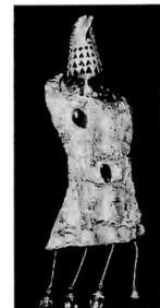
図版 12 ブルガリア ベトロッサ出土 わし型の金製ブローチ 東ゴート族のもの