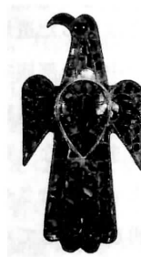
図版 11 アラゴン地方 カラタユー出土