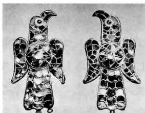
図版 10 ディエラ・デ・バロス 出土のもの