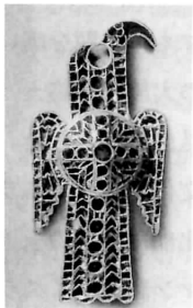
図版 9 ニュルンベルグの東ゴート族のわし型ブローチ