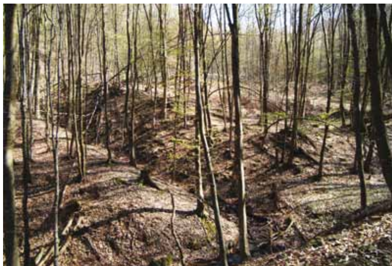
Slika 1. Pogled s jugoistoka na samostanski sklop Blažene Djevice Marije

u teško pristupačnom klanacu samostan bio izoliran, dodatno osiguranje sklopa riješeno je opkopima s tekućom vodom. Time je određen pravokutni plato koji su zatvarali koljeno potoka Kamenjače (Crkveni jarak) s istočne i južne strane te dva umjetna kanala sa sjeverne i zapadne strane (slika 1.).