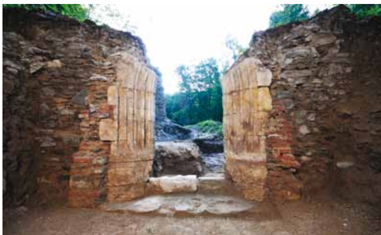
Slika 4. Zapadni portal samostanske crkve Navještenja Marijina

Iz prostora lađe (1.665 x 860 cm) gotovo je u cijelosti uklonjen oko 350 cm debeo sloj zasipa. Unutar sjevernog dijela lađe nije istražen dio uz sjeverno rame kako se ne bi narušila njegova statička sigurnost. Tijekom radova istražen je izvrsno sačuvan kasnogotički portal na zapadnom pročelju. Raskošno je profiliran uobičajenim ritmom izmjene torusa, konkave i „kruške“ (vanjska širina: 235 cm; unutarnja širina: 160 cm; puna dubina: 150 cm), dok pri dnu profilacije ima karakteristično skošenje. Prag je sastavljen od dva masivna klesanca (prosječni h – 339.50 m). Portal je izrađen od vapnenca (kalkarenit) 20 , a na njemu nisu pronađeni tragovi oslika. Bočno od profiliranih dovratnika pronađena su vertikalna ojačanja izgrađena od naizmjenično postavljenih redova opeke i lomljenog vapnenca s obilatim korištenjem veziva krupnog granulata (širina 45 cm) (slika 4.).