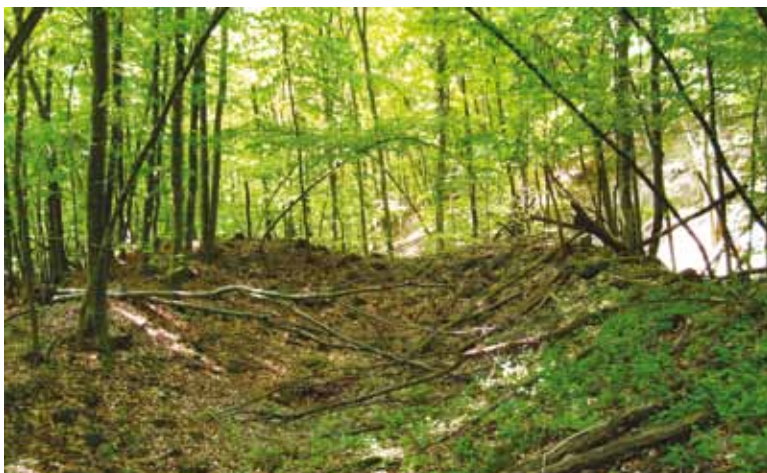
Slika 2. Pogled iz svetišta prema lađi samostanske crkve prije početka arheoloških istraživanja (foto: T. Pleše, 2009.)

Tijekom dvije sezone arheoloških radova istražena je crkva po cijeloj dužini (od zapadnog pročelja do tjemena poligonalne apside) unutar sjevernog dijela longitudinalne simetrale. Time je postalo moguće rekonstruirati njene vanjske (dužina 3.155 cm, širina 1.050 cm) i unutarnje (lađa: 1.665 x 860 cm; svetište: 1.275 x 650 cm) dimenzije. Lađa je od svetišta bila odijeljena trijumfalnim lukom, čije dimenzije svijetlog otvora za sada nije moguće sa sigurnošću odrediti (slika 2., slika 3.).