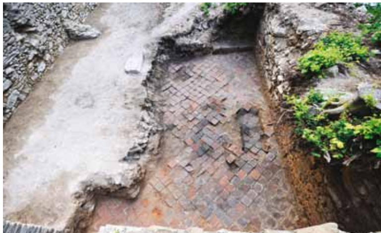
Slika 5. Podnica u jugozapadnom dijelu samostanske crkve Navještenja Marijina

za sada nije moguće reći (slika 5.). U tom dijelu lađe pronađena je i donja stepenica južnog oltara (dužina 185 cm; prosječni h 339 – 65 m).