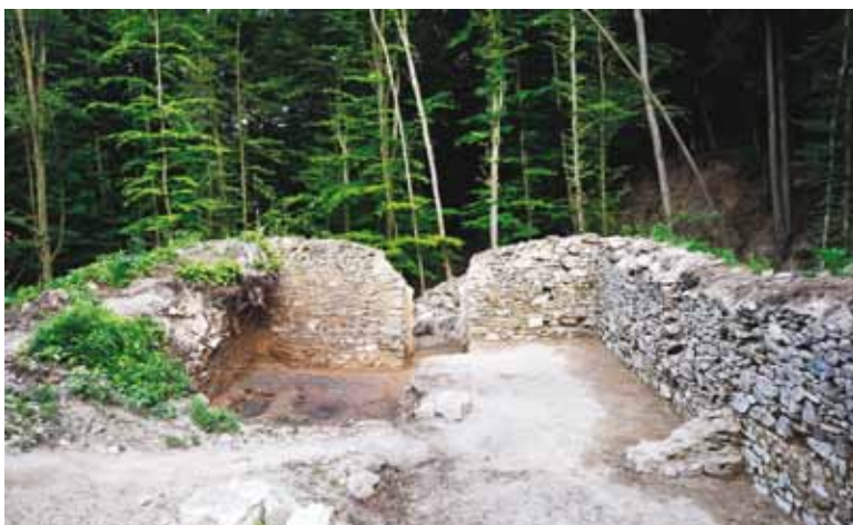
Slika 3. Pogled iz svetišta prema lađi samostanske crkve nakon arheoloških istraživanja 2010.