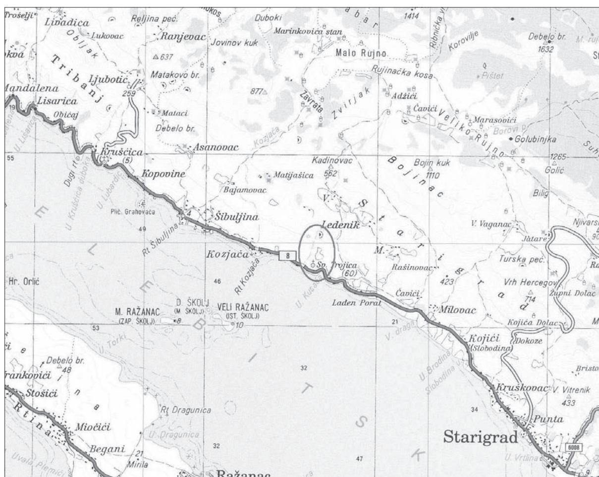
Karta 1 Položaj lokaliteta Gradina Sv. Trojica.

Ključne riječi: Starigrad, Gradina Sv. Trojica, prapovijest, posljednja faza liburnske kulture, bizantski kastrum Key words: Starigrad, Gradina St. Trojica, prehistory, last phase of the Liburnian culture, Byzantine castrum