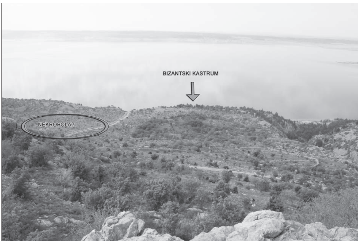
Sl. 3 Ostaci ranobizantske utvrde i vjerojatni položaj nekropole.