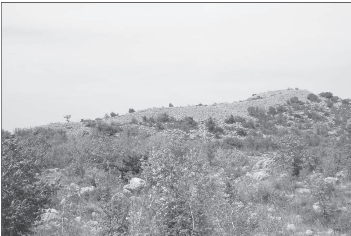
Sl. 2 Sjeverni bedem, s akropolom na zapadu. Pogled sa sjeveroistoka.