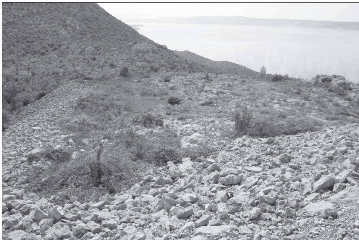
Sl. 1 Pogled na glavni plato sa sjeverozapada.