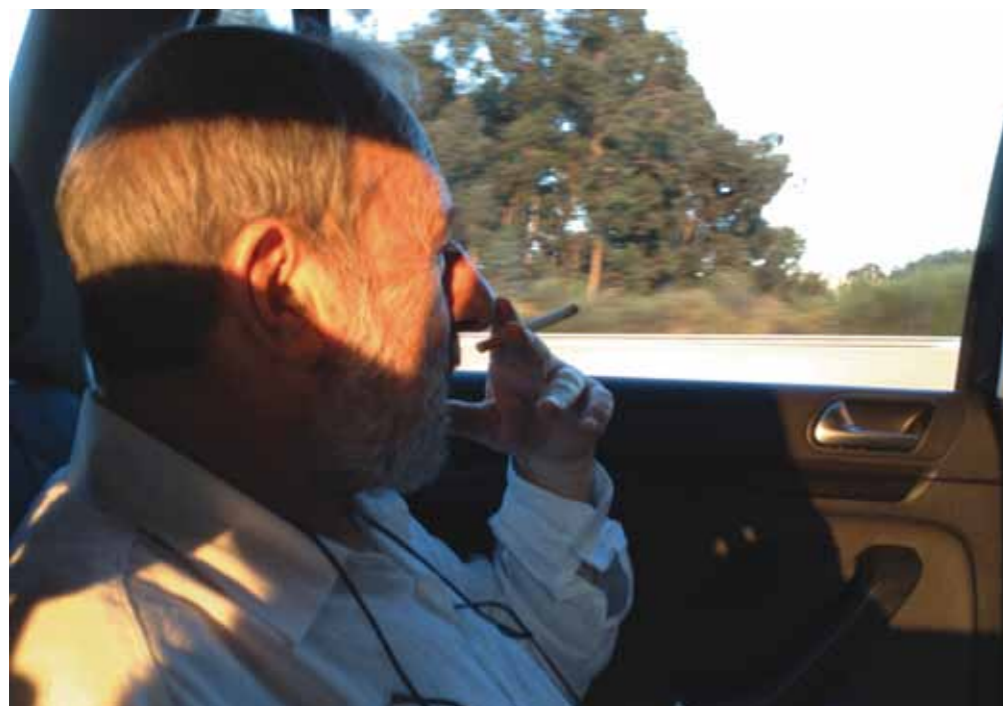
Álvaro Siza