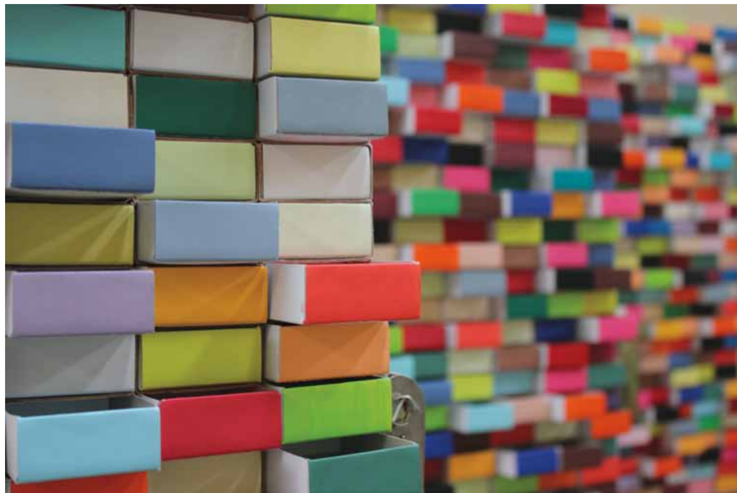
Cada Casa é um Caso (Arquivo Geral), 2012. Caixas de fósforos, tintas acrílicas, estrutura de madeira e esticador