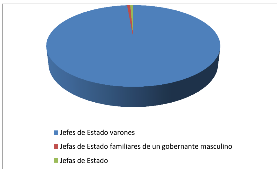
Gráfica 2. Jefes de Estado de países independientes en el siglo XX