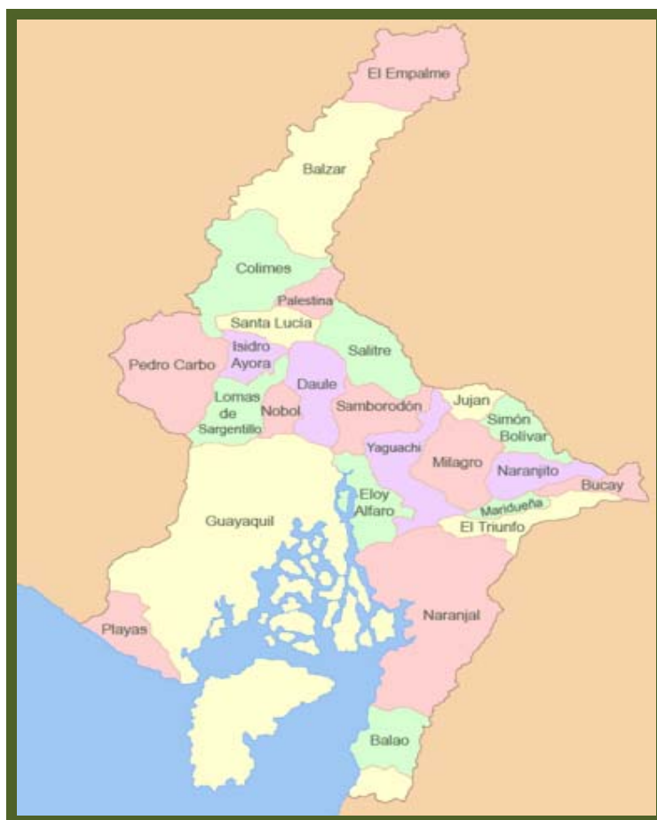
Fig. N°1 Mapa de la de la Provincia del Guayas

asistencia social y económica, y administrar, en ciudades menores, infraestructuras tales como parques, distritos escolares y sistemas de saneamiento básico.