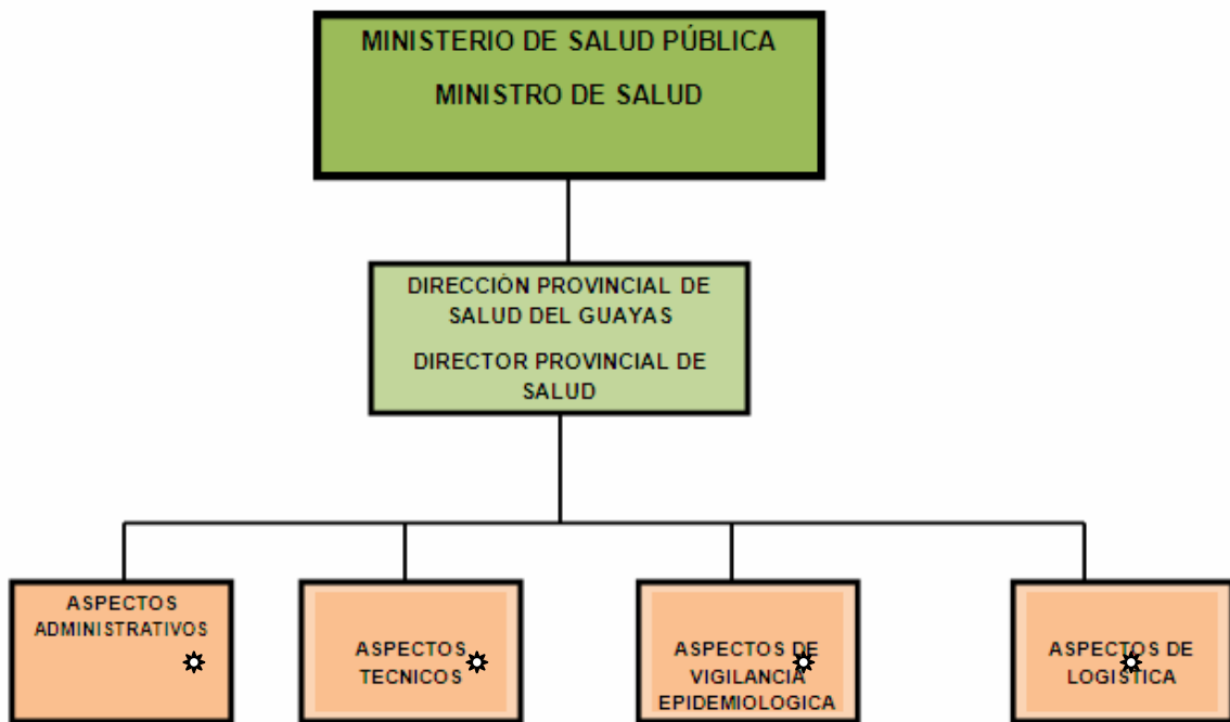
Fig.2.- Estructura PARA LA IMPLEMENTACION DE LA GUIA PARA LA PREPARACION DEL SECTOR SALUD ANTE UNA POSIBLE PANDEMIA DE INFLUENZA EN LA DIRECCION PROVINCIAL DE SALUD DEL GUAYAS.

*Cada uno de los aspectos estará a cargo de un responsable designado por el coordinador del respectivo proceso o por el Director Provincial de Salud.