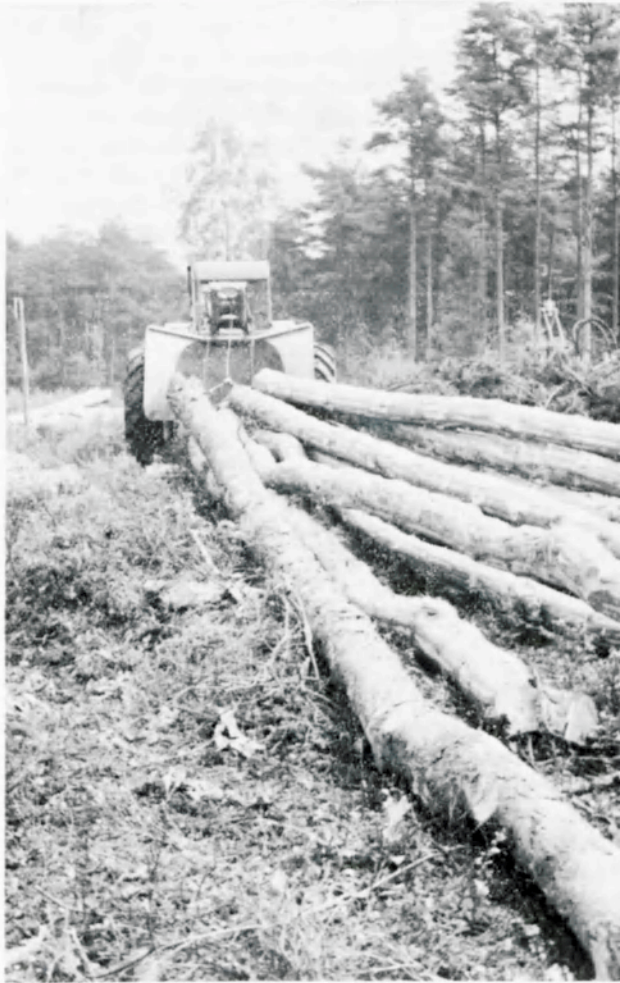
Bosbouwtrekker voor het uitslepen van langhout

beeld f 6 per m 3 bedragen en bij 1000 uren bijvoorbeeld f 5 per m 3 .