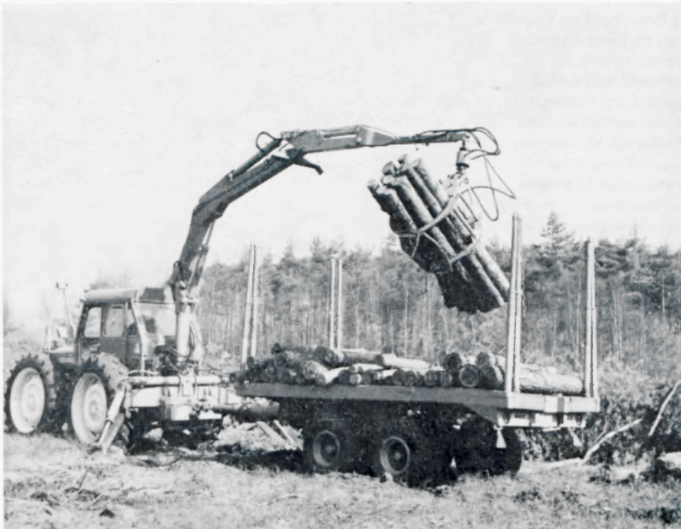
Trekker met kraan en bogie- trailer voor het laden en uit- rijden van standaardsortiment