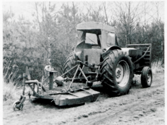
Trekker met slagmaaier bij terreinvoorbereiding en bosverzorging

Horizontale samenwerking bij de uitvoering van werk geeft de mogelijkheid tot het gemeenschappelijk inzetten van werktuigen, machines en arbeid. Hierdoor wordt een betere benutting van de capaciteit mogelijk, waardoor op korte termijn goedkoper kan worden gewerkt. Zo kunnen de kosten voor houtuitsleep met landbouwtrekkers bij 500 draaiuren per jaar bijvoor-