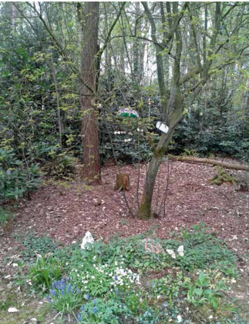
Graf op natuurbegraafplaats waar meer wordt toegestaan.

In verband met de effecten op de natuur wordt bij de bestemming 'bos of natuur' met een dubbelbestemming of functieaanduiding 'natuurbegraafplaats' voorwaarden gesteld aan het aantal graven per hectare. Dat varieerde in 2014 van 100