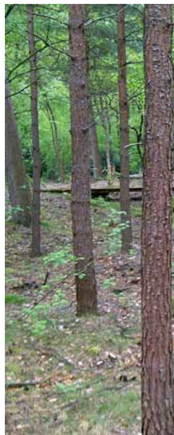
Omvorming van landbouwgrond naar natuurbegraafplaats