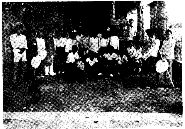
圖右上：全隊往小池角採集途中攝於通樑榕園。