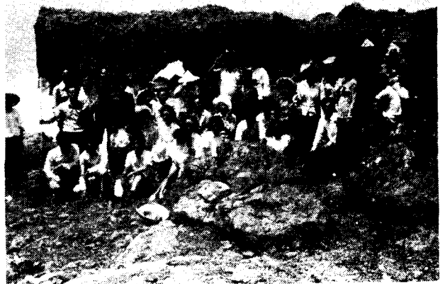
圖右下：全隊於小門採集蟬蟲後攝於鯨魚洞。