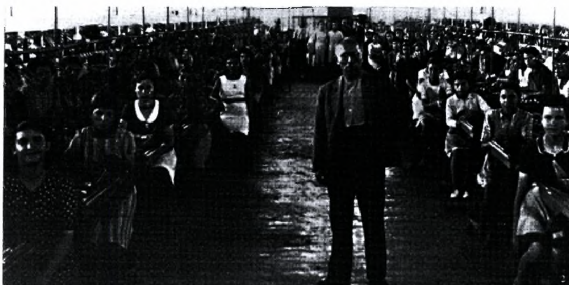
Εικόνα 3 :Εργάτριες πρόσφυγες στο Μεταξουργείο Ετμεκτζόγλου (από το βιβλίο «Βόλος, ένας αιώνας από την ένταξη στο ελληνικό κράτος(1881) έως τους σεισμούς (1955), επιμ. Αίγλη Δημόγλου, σελ. 149)