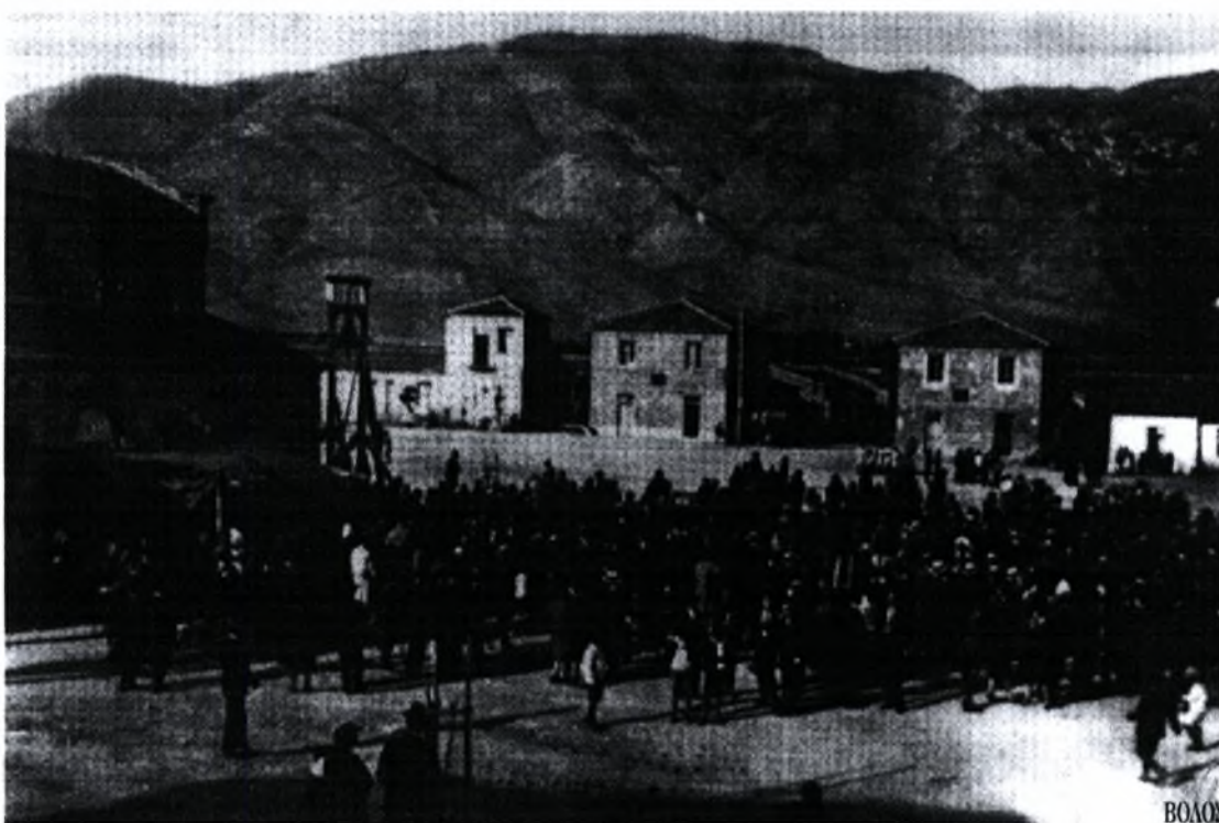
Εικόνα 4 :Πάσχα στον προσφυγικό συνοικισμό της Νέας Ιωνίας, 1927 (από το βιβλίο «Βόλος ...ό.π», σελ. 47)