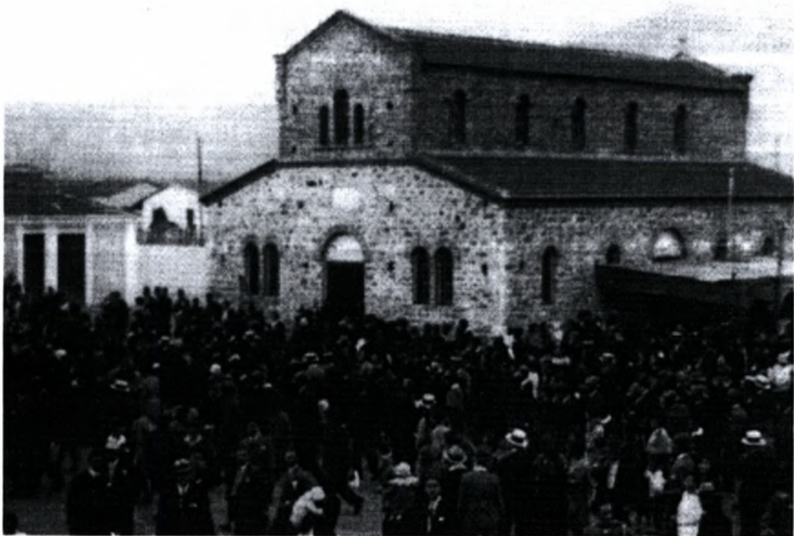
Εικόνα 2 : Η εκκλησία Ευαγγελίστρια στην Νέα Ιωνία (από το βιβλίο « Βόλος ένας αιώνας από την ένταξη στο ελληνικό κράτος(1881) έως τους σεισμούς (1955) επιμ. Αίγλη Δημόγλου, σελ. 266)