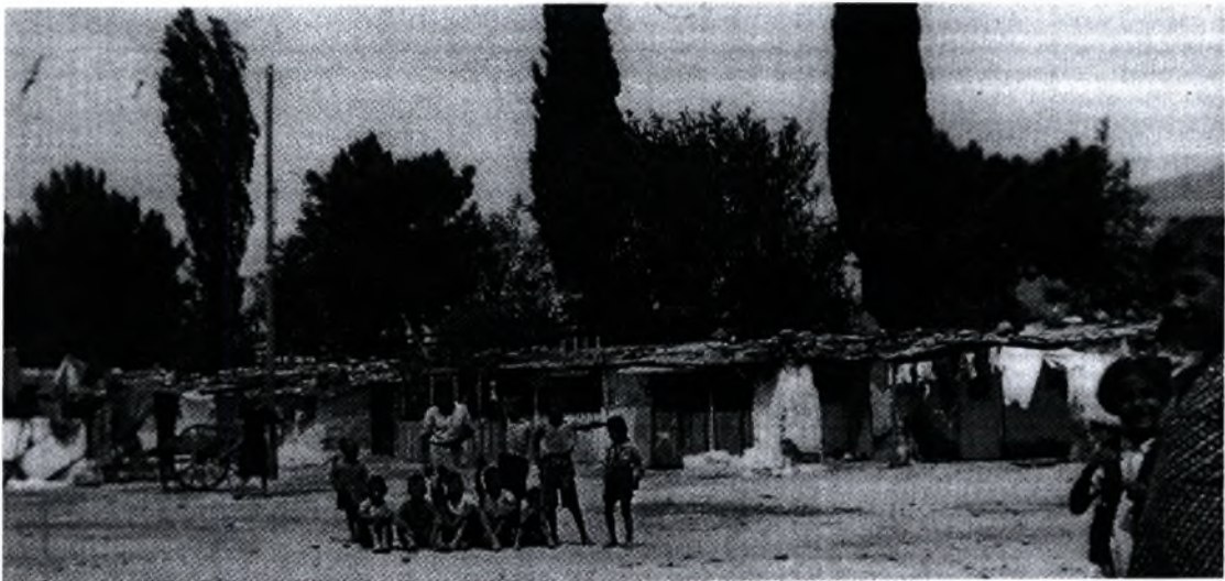
Εικόνα 1 : Προσφυγικός συνοικισμός της οδού Ιωλκού (από το βιβλίο «Προσφυγική Ελλάδα» Κ.Μ.Σ. σελ. 137)