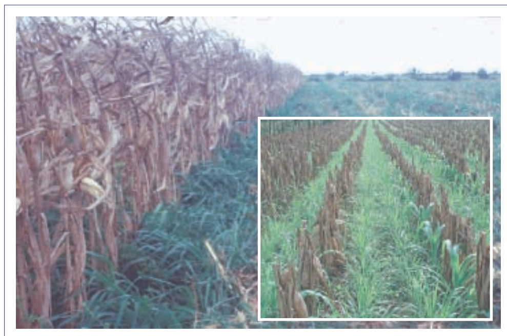
Foto 3. Establecimiento exitoso del cv. Mulato sembrado conjuntamente con maíz en Guatemala (inserto) y en la Altillanura colombiana.