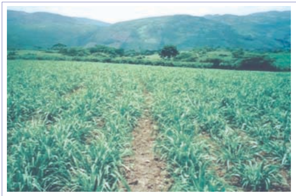
Foto 2. Cultivar Mulato 40 días después de sembrado en una finca en Sulaco, Honduras. Nótese el alto vigor y desarrollo de la planta.

Resultados de buen establecimiento del cv. Mulato se muestra también en el Cuadro 3, donde se ve que en menos de dos meses después de la siembra las plantas de esta gramínea alcanzaron un promedio de 80 cm de altura (rango de 40 a 110 cm) y 83% de cobertura (rango de 65 a 90%) en 5 fincas del departamento de Yoro en Honduras. Todas las siembras se hicieron a chorrillo y sobre surcos separados a 50 cm; las tasas de siembra por ha variaron entre 3.5 y 4.0 kg de semilla con pureza y germinación mayor a 80%. Las variaciones de altura de