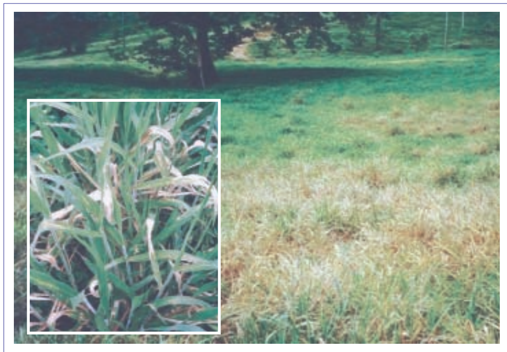
Foto 4. Necrosis foliar en el cv. Mulato causada por el hongo Rhizoctonia solani en un potrero bajo uso en el Alto Sinú, Colombia.

los cuales florecen entre mayo y junio de cada año, al comienzo de las lluvias. Lo anterior es una característica deseable del cv. Mulato, dado que permite un período más largo de pastoreo sin que pierda calidad el forraje por el inicio temprano de la floración. Sin embargo, puede dificultarse la cosecha manual de semillas por alta humedad ambiental durante el mes de octubre, y pérdida de espiguillas maduras por acción de las lluvias; además, las condiciones de alta humedad relativa durante el desarrollo de las espiguillas favorece la presencia de hongos en las mismas, particularmente de los géneros Phoma y Drechslera , como ha sido reportado en otras especies de Brachiaria (García y Pineda, 2000).