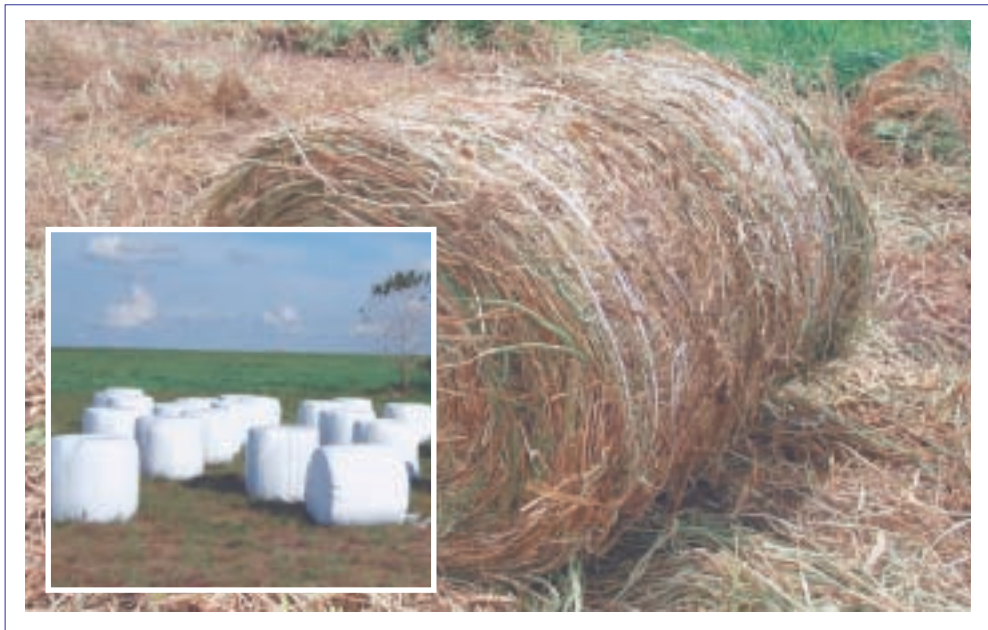
Foto 5. Henolaje del cv. Mulato y detalle de conservación del mismo en silo pacas (inserto).

comunicación personal). Sin embargo, fertilizaciones posteriores con nitrógeno del pasto en este sitio han mostrado respuesta adecuada al nutriente, pero pérdida del efecto fertilizante sobre el pasto en corto tiempo (menos de 3 meses).