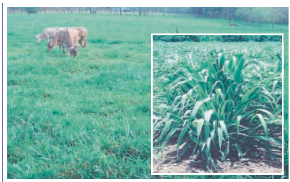
Foto 1. Planta en desarrollo del cv. Mulato de 40 días de edad (inserto) y cobertura total del suelo en un potrero con más de un año de pastoreo en Huimanguillo, México.

El cv. Mulato crece bien desde el nivel del mar hasta los 1800 m.s.n.m. en trópico húmedo con altas precipitaciones y períodos secos cortos, y en condiciones subhúmedas con 5 a 6 meses secos y precipitaciones anuales mayores de