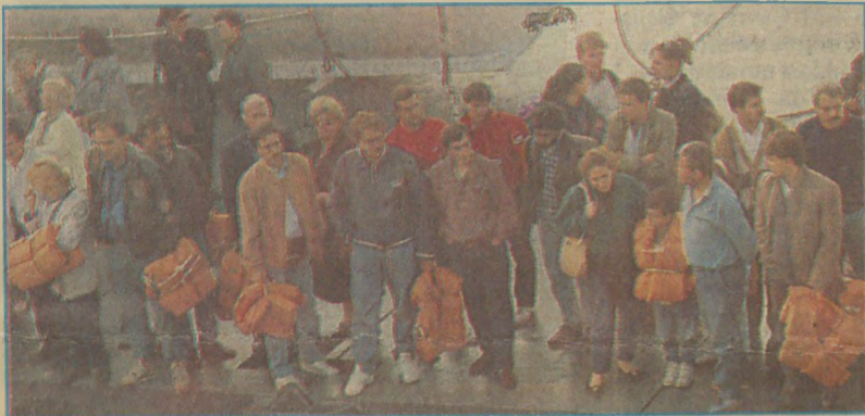
Kurtulanlar uzun süre can yeleklerini ellerinden bırakamadı