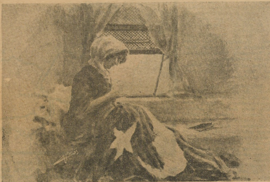
Milli kuvvetler için bayrak diken bir Türk kıza.

Bayındır, Tire, Ödemiş, Salihli bölgelerinde 500 den fazla Türk tevkif edildi. Göçmenler arasında yüzlercesi soğuktan öldü