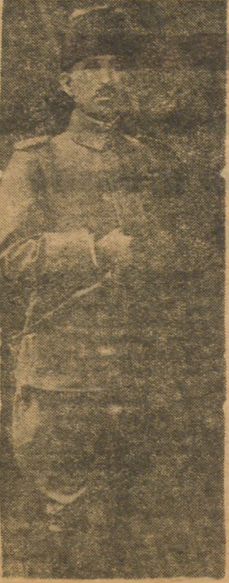
Edirne'de Kolordu Kumandanı Cafer Tayyar Bey.

FRANSIZ GENERALI, YUNANLILARIN ZULMÜNDEN ŞİKAYET EDEN KOLORDU KUMANDANINA "BU, HARPTTE YAPTIĞINIZ ZULMÜN KARŞILIĞIDIR" DEDI