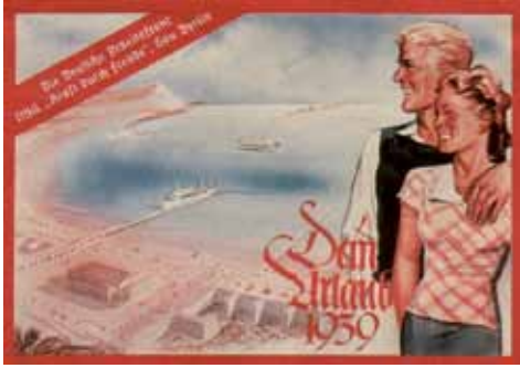
KdF plakat. Wallraf-Richartz-Museum.