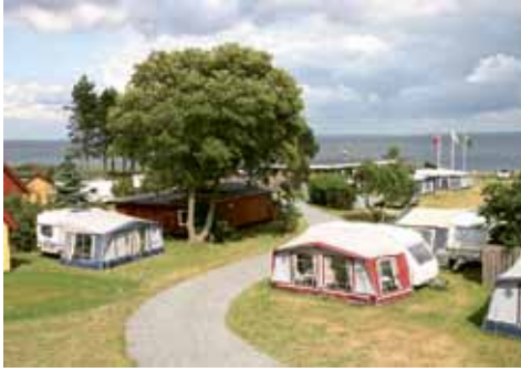
Lundø Camping, 2010. www.lundocamping.dk