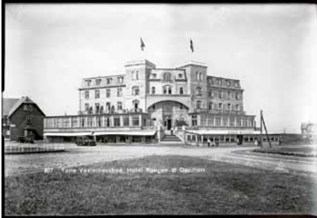
Fanø Vesterhavsbad, Hotel Kongen af Danmark.

pludselig blev badestedet et tysk foretagende. I 1892 blev Kurhotellet indviet, og det var indrettet efter datidens internationale hotelstil med læseværelser og en stor spisesal. Snart efter blev Strandhotellet og Hotel Kongen af Danmark indviet, ligesom der blev opført overdådige villaer i nærheden. A/S Nordsøbadet ejede Kurhotellet, mens de to andre hoteller og villaerne var på danske hænder, ikke desto mindre måtte de indordne sig under aktieselskabets direktion.