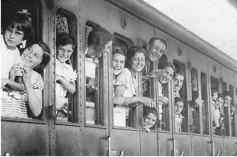
Les premiers congés payés de 1936.

mange tyskere og østrigere tilsluttede sig nazismen, er Kraft durch Freude måske et af svarene. Mellem 1934 og 1939 stod KdF-Reisen for syv millioner selskabsrejser, hvilket gjorde det til verdens største rejsebureau. 20