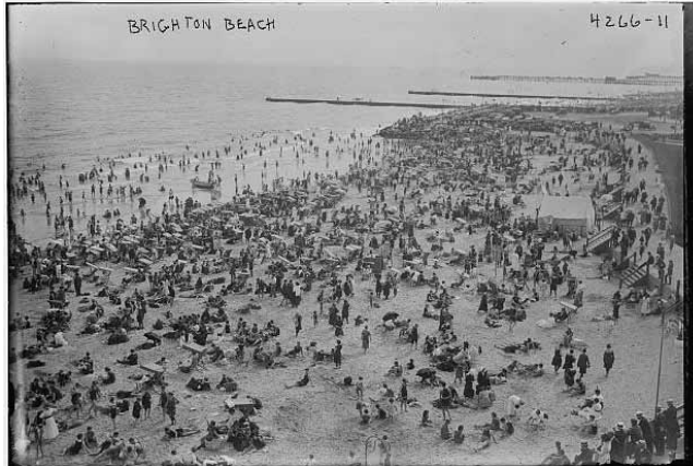
Brighton Beach, Brooklyn, New York, 1905. The United States Library of Congress's.