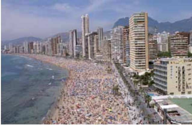
Benidorm, Spanien. 2009.

Vore dages masseturisme, charterrejser og krydstogter står alle i gæld til de tiltag, som blev udviklet i 1930'erne, da lønarbejderne fik ferie med løn. Rejseselskaber har ansat unge muntre mennesker som guider, og ligesom Butlins rødjakkere er de uniformerede og sørger for, at turisterne aldrig har et kedeligt øjeblik. Hele ugen på feriestedet er nøje planlagt, og uanset om man ankommer til Mallorca eller Marokko eller Kreta, foregår charterferien på samme måde.