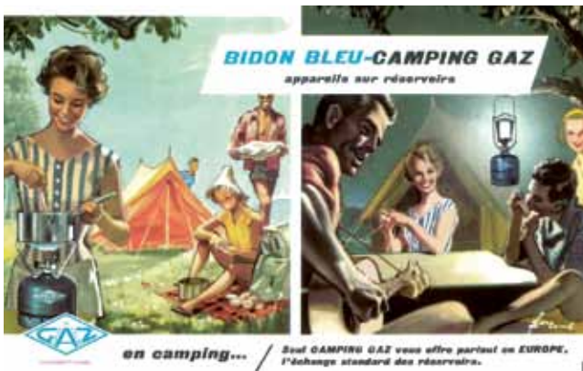
Reklame for campinggas, 1950'erne.

omdannet til Jugendherberger. I Borggaarden paa Stahleck ved Rhinen leger Hitlerdrene i deres praktiske Uniformer." Det gør de sandelig også, og det hele ser meget tilforladeligt ud.