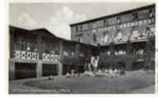
Flindts Badehotel i Lohals, 1932.

ralinden, som hun kender fra København og siger til hende, mens hun ser på de dansende: "Hvor det egentlig er underligt at sidde og se paa alle de Mennesker, som ikke hører os til, det er dog altid som at være paa Komædie."