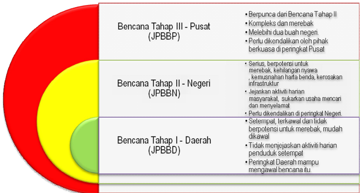
Rajah 1: Tahap kejadian bencana dan jawatankuasa yang berkaitan

Berdasarkan MKN-20, pengurusan bencana dikategorikan kepada tiga tahap mengikut turutan keseriusan bencana, impak kepada penduduk dan liputan kawasan bencana tersebut, iaitu Bencana Tahap I, Bencana Tahap II dan Bencana Tahap III sebagaimana yang ditunjukkan dalam Rajah 1.1. Rajah 1.1 meringkaskan tahap bencana yang Tahap I boleh dikendalikan oleh pihak berkuasa di peringkat Daerah, Tahap II di peringkat Negeri, dan Tahap III di peringkat Pusat serta Jawatankuasa yang terlibat. Bagaimanapun, ketentuan tahap bencana bergantung kepada penilaian pihak berkuasa di Daerah/Negeri/Pusat untuk menentukan pengurusan atau mencadangkan pengambilalihan pengendalian bencana oleh pihak yang lebih tinggi.