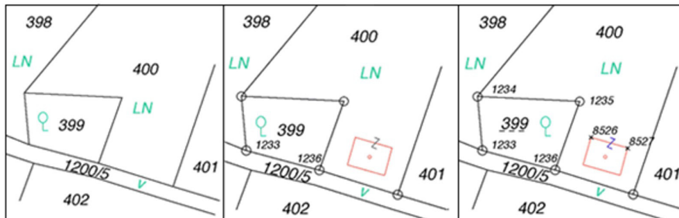
Slika 2 Vzdrževanje DKN, kjer je nazorno (grafično različno prikazan) viden način vzdrževanja v vseh treh obdobjih opisane avstrijske zakonodaje (BEV, 2011).

srednja slika prikazuje domeritev (zemljišče pod stavbo), desna slika pa vsebuje že podatke mejnega katastra. Zemljiška parcela 399 je koordinatno določena in je kot taka zavedena v bazo mejnega katastra.