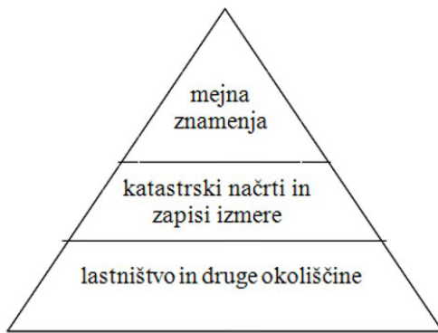
Slika 6: Hierarhična uporaba katastrskih podatkov na Švedskem (Swensson, 2010)

Položajna natančnost za digitalne katastrske načrte je podana s standardnim odklonom, in sicer ločeno za horizontalni položaj in višino. Splošna zahteva za položajno natančnost je določena le za fotogrametrično kartiranje, kjer je ocenjeni standardni odklon 2 m za horizontalni položaj in višino. Pri katastrskih postopkih in na splošno pri uporabi podatkov zemljiškega katastra zakon na Švedskem zelo strogo določa hierarhijo zanesljivosti podatkov o izmerjenih mejah – glej sliko 6 (Swensson, 2010).