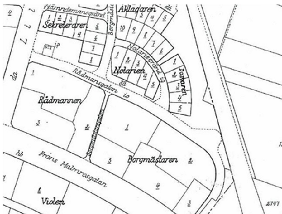
Slika 5: Izsek iz grafičnega dela digitalnega zemljiškega katastra NCIM v urbanem okolju v merilu 1 : 2000 (Olsoon in sod., 2006)

Podobno kot v drugih obravnavanih državah je treba tudi v švedskem sistemu zemljiške administracije, natančneje pri položajni zanesljivosti grafičnih podsistemov zemljiškega katastra, upoštevati izvor podatkov digitalnih katastrskih načrtov. Na sliki 5 podajmo primer katastrskega načrta za urbana območja, kjer za Švedsko velja, da so podatki relativno kakovostni, tudi zaradi izredno dobrega strokovnega sodelovanja med državno geodetsko službo, ki skrbi za kakovost podatkov zemljiškega registra kot javnega pomena za državo, in lokalno skupnostjo, za katero so kakovostni podatki o nepremičninah ključnega pomena za načrtovanje in odločanje o prostoru.