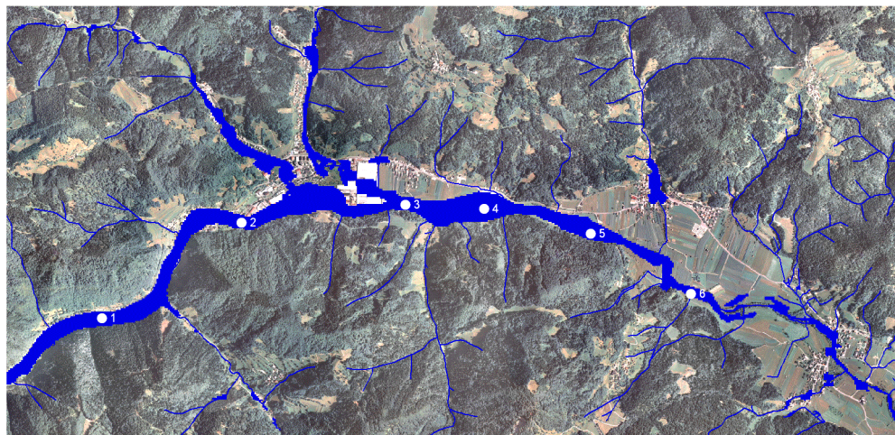
Slika2: Prepoznana poplavljenja območja v zgornjem delu Selške doline (temneje obarvana) in šest merilnih mest, na katerih so bili določeni pretoki (oštevilčena z vrednostmi od 1 do 6).