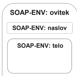
Slika 2: Sestava sporočila SOAP (Simple Object Access Protocol)