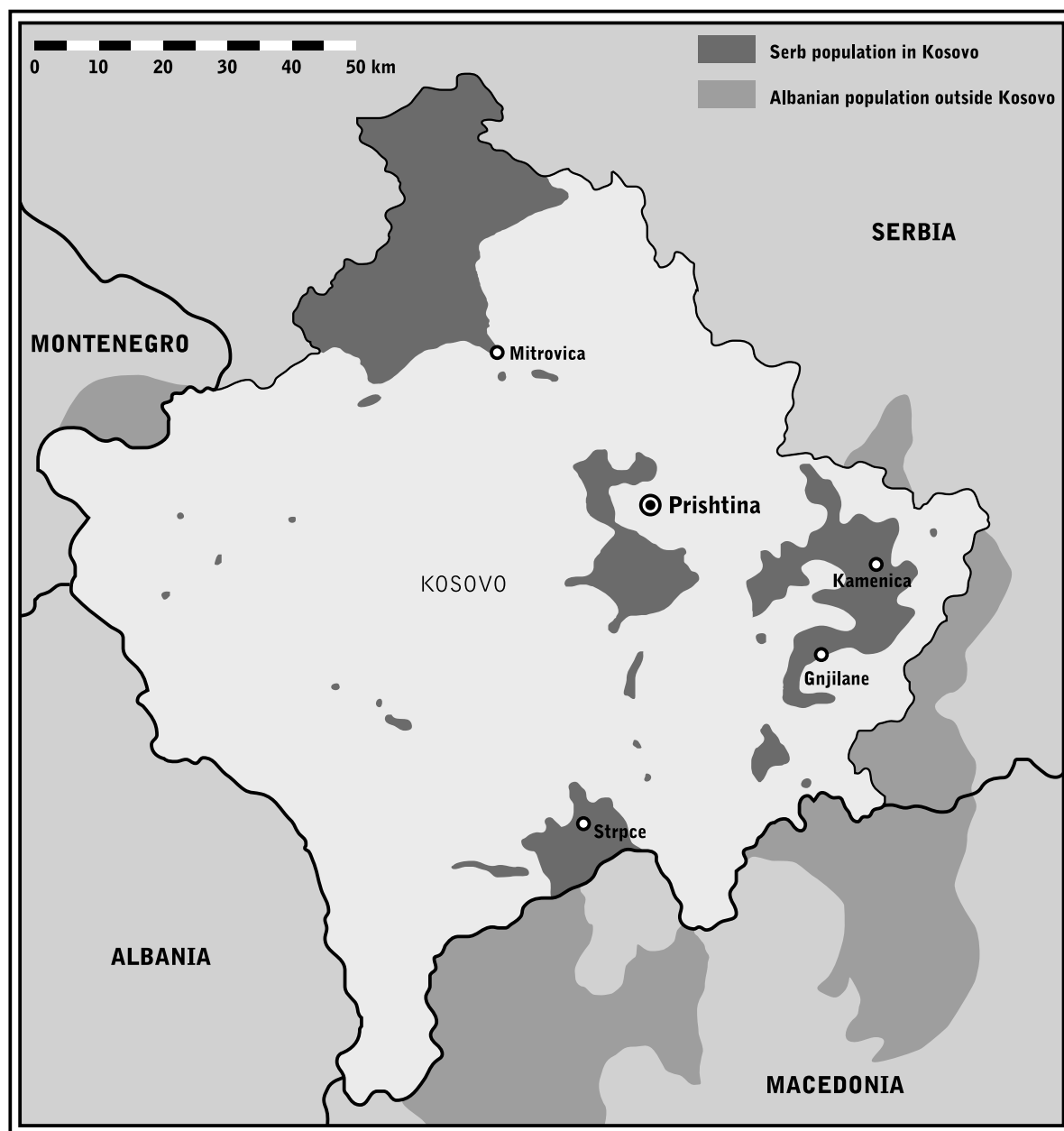
Map 1. Serb population in Kosovo and Albanian population outside Kosovo

tive trend, however, was undermined in March 2004 when the anti-Serb riots broke out.