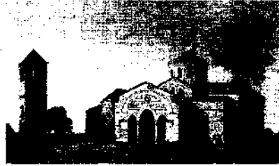
Trabzon'da Ayasofya Kilisesi

Sancakbeyinin sancak yönetiminde temel rolü doğrudan doğruya kendisinin ve kendi temsilcilerinin şehir ve kasaba yöneticisi olması denebilir. "Nefs-i şehri" adı altında toplanan vergilerin oranı, belli bir yörede şehirleşme ve şehir ekonomisi boyutlarını göstermek bakımından da ilgi çeker ama bu konuyu başka çalışmalara bırakalım.