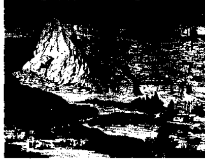
Kars, genel görünüm. (Russes et Turces La Guerre D'Orient, 1878)

Çoğu has dökümünde şehir merkezi gelirleri toplu bir şekilde bir tek rakkamla ifade ediliyor, ama bazı sancaklarda bu gelirlerin hangi kalemlerden oluştuğu da gösteriliyor.