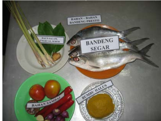
Gambar 2. Bahan-bahan yang digunakan dalam pembuatan bandeng duri lunak