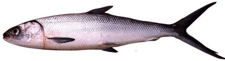
Gambar 1. Ikan Bandeng ( Chanos chanos Forsk)

Menurut Ghufron (1994), ikan Bandeng ( Chanos chanos Forsk) dapat tumbuh hingga mencapai 1,8 m, anak ikan Bandeng ( Chanos chanos Forsk) yang biasa disebut nener yang biasa ditangkap di pantai panjangnya sekitar 1 -3 cm, sedangkan gelondongan berukuran 5-8 cm.