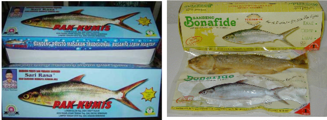
Gambar 4. Contoh bahan pengemas yang digunakan untuk mengemas bandeng duri lunak. Pada bahan pengemas dicantumkan informasi tentang produk.