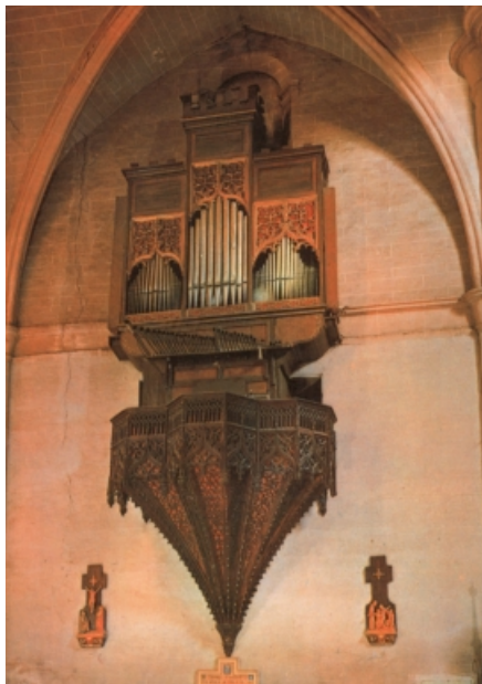
Órgano gótico de la Iglesia de San Pedro de los Francos de Calatayud.