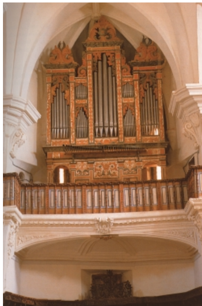
Organo barroco de la Iglesia de Santo Domingo de Daroca.

mistas y cantorcitos o seisillos. El maestro de capilla no solo preparaba y regía la capilla sino que tenía que componer en latín y romance para el culto solemne del Oficio y la Misa, y cuidar del alojamiento, sustento y de la educación humanística, musical y religiosa de los infantes.