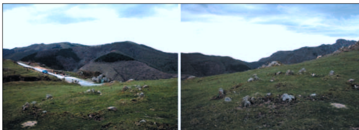
Alto de Agiña. Fotografía de cromlechs (2005).

Para mejor constatación de las cuestiones dichas hasta ahora, resulta adecuado recordar aquí el criterio aludido por la Junta del Grupo Aranzadi en el referido texto titulado Memorial al Padre Donosti (sic), la cual anotaba sin dudar la evidencia de las características del paraje previsto para el monumento: Muy pronto se eligió el sitio del emplazamiento, lugar grandioso y solitario y que domina especialmente la región donde él vivió y trabajó la mayor parte de su vida 17 .