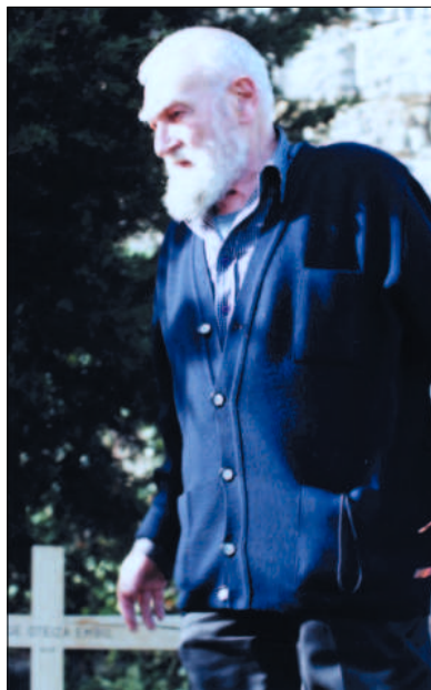
Oteiza con su tumba al fondo (Alzuza, Navarra)

Para la obra teórica y práctica que Oteiza desarrollará durante la etapa crucial de la década de los años 50 del siglo XX, el punto raíz del mencionado texto reside en que estos yacimientos le proporcionaron los restos primordiales de un pueblo que por vez primera extraía de su racionalismo mágico una verdadera solución existencial: La estatua, la estatua original 4 dirá, que atrapaba sus mitos con la piedra elemental fabricada para su salvación espiritual. En realidad era el encuentro buscado con una escultura matriz, independiente, y sin influencias donde poder analizar y reconstruir la situación existencial original del hombre encerrado en la finitud de la vida con la dificultad de tomar conciencia de su propia muerte (y la del "otro"). Una conciencia de la muerte que debió imprimir en el hombre una huella experiencial tan indeleble que se volvió parte constitutiva de su identidad de sujeto y de su proceso de humanización. Por esta constatación de los límites de la vida, este hombre configuró un lugar para la existencia de la muerte y para la pregunta sobre el significado de ser y estar muerto y, en compensación a la inquietud que debió producirle el corte del continuum de la existencia, este hombre también elaboró "el más allá", una de la más remotas hipótesis místicas (...) la supervivencia de la vida después de la muerte en palabras de Malinowski 5 .