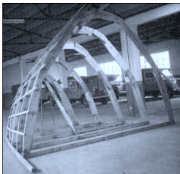
Modelo para la Capilla de Agiña s/f.

Estela funeraria Prometo (1956/57), Estela al Padre Lete, Estela para un pueblo pacífico que era Guernica y Estela funeraria para España de 1957, Par móvil (1956), emplazado en Betahaundi como señal y con función de estela funeraria, Estela a Galíndez (1958), Estela a Madoz y Estela para el Exilio de 1972, Estela funeraria para Aresti (1973), son algunos de los títulos dados por Oteiza a varias de sus esculturas. Durante el tercer cuarto del siglo XX, afianzado el cambio generacional y la renovación de la práctica escultórica en el ámbito de lo que entonces se denominó Escuela vasca, además de Oteiza, escultores como Chillida y Basterretxea aplicaron también la palabra Estela a títulos de obras escultóricas. Además de hacer esta referencia por sus potenciales metafóricos y/o connotativos y formales, capaces de levantar imaginarios colectivos y particulares según fuera la idiosincrasia del que las mirarse, esta circunstancia permite pensar la importancia que la referencia Estela tenía, pudiendo especular que funcionaba, en la cultura vasca, como un significante con gran capacidad metonímica. Como indica el mencionado Zulaika, en relación a las estelas discoideas vascas, es precisamente su organización interna irradiativa desde el centro y su circularidad periférica lo que caracteriza el disco de las mencionadas estelas. Aludiendo a esta idea de espacio redondo cerrado, vacío, irradiativo, establece la correspondencia con la visión finita