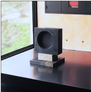
Escultura Homenaje Padre Donostia , 1957. Fundación Museo Jorge Oteiza.

La Estela funeraria era una escultura moderna. Y en la praxis de Oteiza se situaba en un límite. Por su apariencia 38 (fotos 5 y 6), desde una primera apro-