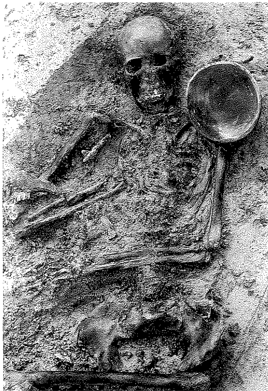
Graf 398 uit het vroeg-middeleeuwse grafveld van Oosterbeintum, met als bijgaven fibulae, een kralensnoer, een armband en een aardewerken nap. Zie: KnoI 1993, 213; foto G. Delger, BAI-RUG

Stond in het vorige deel de voorgeschiedenis van het afzonderlijke boerenbedrijf centraal, in dit deel wordt besproken hoe boerenbedrijven relaties met elkaar onderhielden en hoe uit die relaties de latere dorpen ontstonden. De ontstaansgeschiedenis van het middeleeuwse dorp is te vertellen aan de hand van twee thema's, te weten de hiërarchische organisatie van de christelijke religie en de centralisatie van handel en nijverheid.