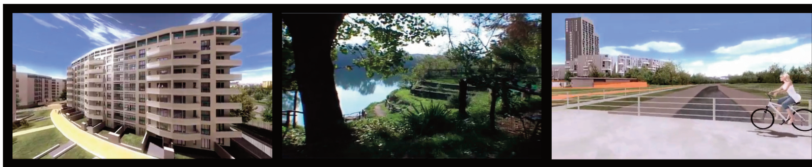
3. Screenshots da Parco Occidentale (7:25), 2009.

Il video, commissionato nel 2006 da Lend Lease ai film makers Squint/Opera, costituisce un esempio singolare per quanto riguarda i linguaggi e le tecniche di comunicazione. I lavori di Squint/Opera,