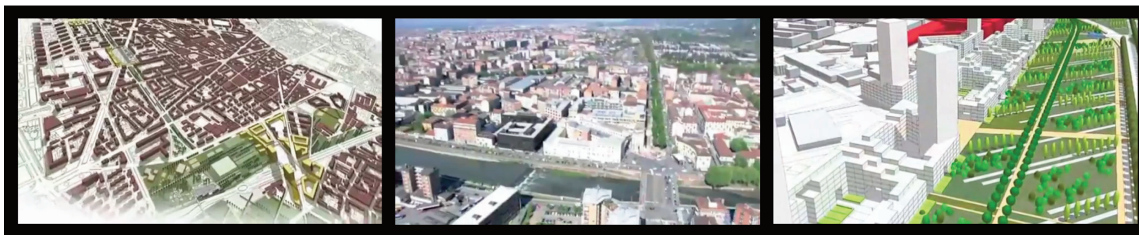
4. Screenshots da Torino al futuro, la linea 2 della metropolitana di Torino (5:41), 2010.

Il film, commentato da una voce narrante, esordisce mostrando, prima attraverso brevi riprese, poi su una carta della città, i principali obiettivi di riequilibrio ambientale perseguiti, anche attraverso la bonifica del fiume con nuovi collettori. Quindi, ognuno degli elementi salienti del progetto viene individuato sulla mappa della città e avvicinato alla realtà attraverso una presa aerea a cui si sovrappone, in forma di cartolina, una foto da terra del luogo prima dell'intervento puntuale, su cui viene sovrapposto il disegno dello spazio proget-