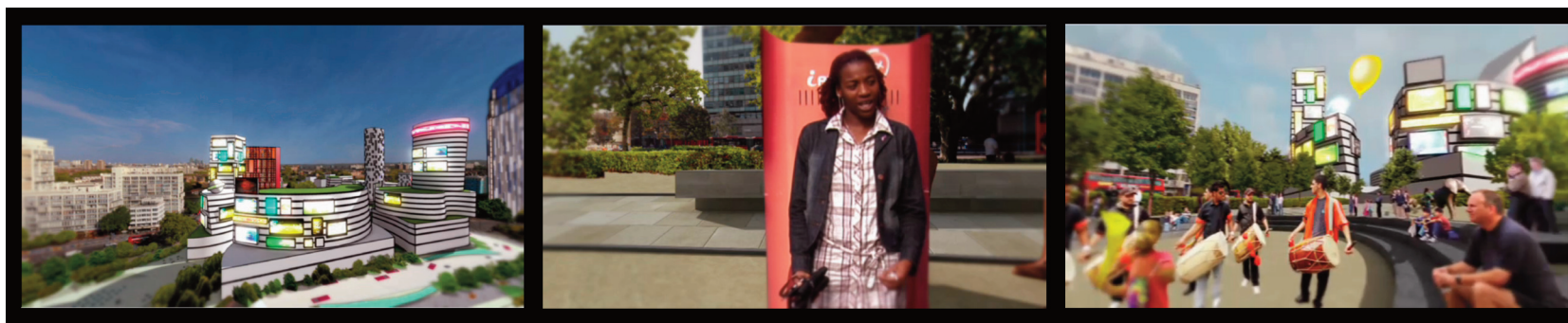
1. Screenshots da Elephant Life (4:29), 2006.

Nella produzione dei video le ibridazioni fra elementi reali e simulazioni digitali vengono realizzate con differenti tecniche rese possibili dalla sopra richiamata convergenza al digitale: la composizione di differenti visualizzazioni bidimensionali e tridimensionali dei modelli digitali, con fotografie e testi, usando la consolidata tecnica dello stop-motion abbinata ad opzioni di movimento come la dissolvenza, lo zoom, la rotazione, lo scorrimento, oggi praticata grazie a software per la post-produzione dinamica, e la modellazione dei manufatti in progetto, inserita dinamicamente in una ripresa dell'ambiente, attraverso la tecnica del camera-tracking [6].