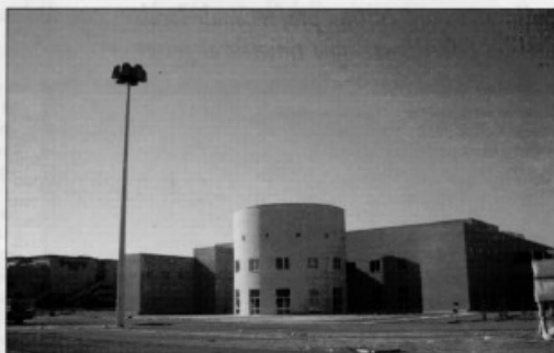
Il centro congressi di Aldo Rossi tra Pescara e Montesilvano

Oggi questo paesaggio urbano, quale sia il giudizio che se ne vuole dare, sta cambiando scala e significato. In qualche modo si potrebbe dire che si sta normalizzando. Tra Pescara e Montesilvano il Centro congressi di Aldo Rossi, vicino all'area detta dei grandi alberghi e al recente Warner Village, è segno di nuove presenze economiche. Così il progetto di Bohigas per l'area De Cecco, quello di Botta per un tea-