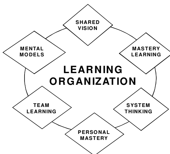
Gambar 1. Organisasi Belajar dari Peter Senge

disiplin yang saling terkait ( The Fifth Disciplines ), meliputi lima komponen: (1) shared vision ; (2) system thinking ; (3) mastery learning ; (4) mental models ; dan (5) team learning . Keterkaitan kelima komponen tersebut dapat divisualisasikan pada Gambar 1.