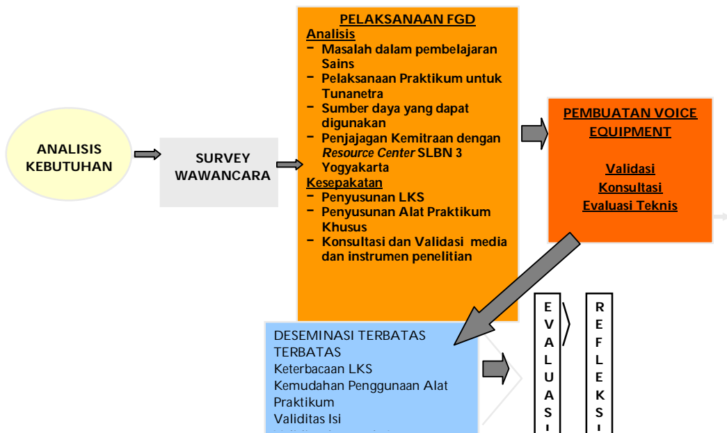
Gambar 3. Diagram Tahapan Pelaksanaan

Tahapan penelitian yang telah berhasil dilakukan pada penelitian ini dapat dilihat pada diagram di bawah ini.