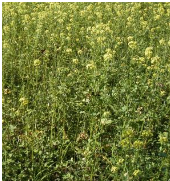
Tilførslen af organics stof gavner jordstrukturen, men reducerer måske også udledningen af lattergas en stor del af året – til gavn for det samlede klimaregnskab.

Vi viser her to eksempler på, at dyrkningspraksis kan påvirke udledningen af lattergas – og dermed sædskiftets klimaregnskab. Sidst i artiklen vender vi tilbage til hvilken praksis, der bedst minimerer risikoen for udledning af lattergas.