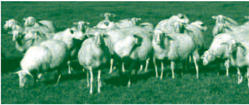
Maximiser l'autonomie fourragère par le pâturage permet d'économiser des charges