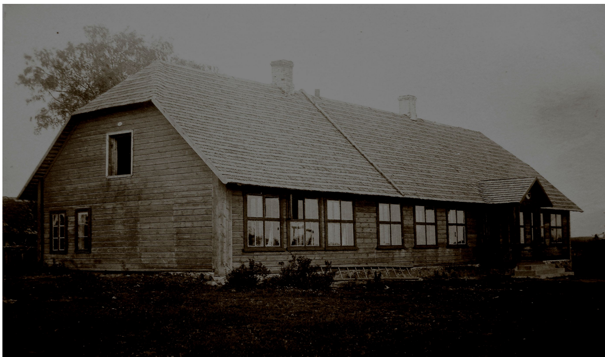
Lisa 11. Karilatsi Algkool 1926. aastal ja Karilatsi Algkool 2006. aastal 129