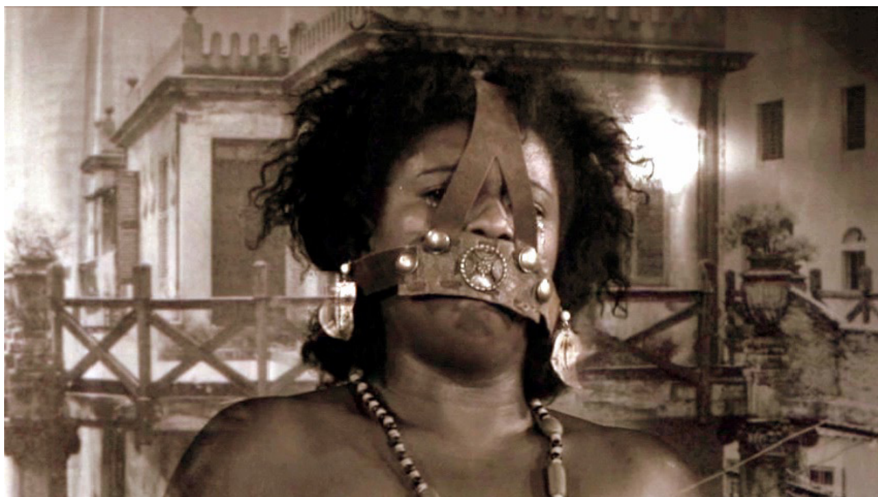
Figure 6 A Terra: Libertas

A sequência acima alude à repetição da violência, à malversação e à opressão perpetradas pelos representantes da ordem (pós) colonial contra o sujeito (subalterno) do Brasil. Deste modo, uma sequência de gramas teatrais díspares - denotando