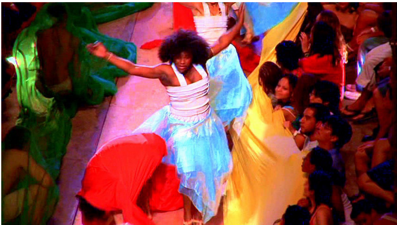
Figura 1 A Terra : Caudal Rio Grande

O primeiro momento cênico que vamos analisar 9 ocorre no contexto desse jogo de tecidos coloridos e semanticamente carregados. Há uma mudança musical repentina para um ijexá 10 – o ritmo sagrado de Oxum 11 – tocado pelos músic