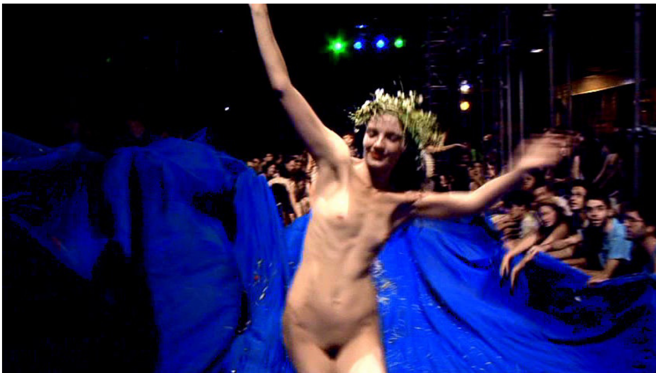
Figure 3 A Terra: Iemanjá

que flutuam no vento. Uma imagem do mar é projetada no tecido do teto. O coro canta: