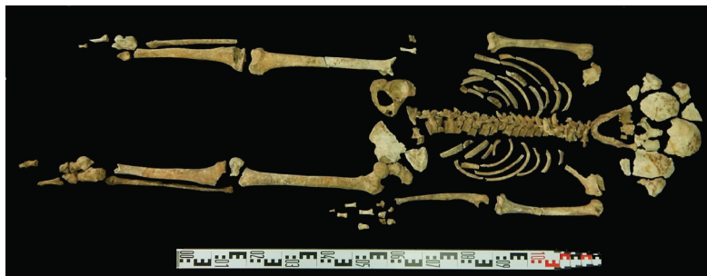
Figura 3. Imagen general del individuo

De acuerdo a las variables analizadas (Todd 1921; Brooks y Suchey 1990; Buikstra y Ubelaker 1994) se trata de un individuo masculino de una edad aproximada de 25-26 años con extremos de 20 a 35 años (figura 3). La estatura fue estimada entre 1,63 m y 1,77 m, a partir de la medición de huesos largos enteros y fragmentados ( i.e. húmero derecho y cúbito izquierdo enteros; fémur izquierdo y tibia derecha fragmentados) (Trotter 1970; Steele 1970).