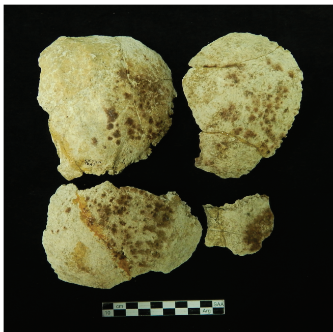
Figura 5. Procesos tafonómicos. Fragmentos de cráneo con marcas de raíces, disolución química y manchas de manganeso

moderados, mientras que en SCHI ésta es mayor, existiendo astillamiento óseo (estadio 3) (Di Donato 2007). Las raíces también tuvieron mayor impacto sobre los restos en SCHI, en relación con los restos de TRQ1, donde las marcas son superficiales. En cambio, en SCHI se registra una potente acción de raíces, que ha provocado la fractura de elementos óseos (Di Donato 2007). En el caso del registro osteológico procedente del sitio Chenque I hay presencia de depósito de carbonatos (Di Donato 2007), la que está ausente en TRQ1. En el SCHI, la presencia de depósito de carbonatos podría ser un indicador de procesos de percolación mineral actuando sobre los restos esqueléticos (Gutiérrez 2004).