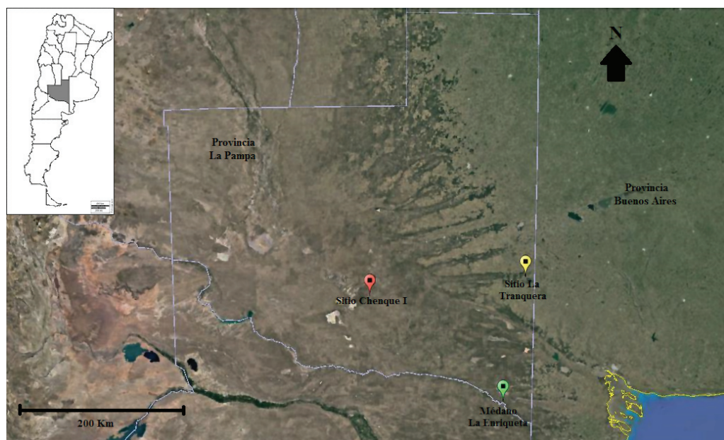
Figura 1. Ubicación del sitio La Tranquera (Colonia San Sixto, departamento Guatraché, La Pampa)

El sitio La Tranquera está ubicado en el área de Valles Transversales, en el sector centro-oriental de la provincia de La Pampa (entre los meridianos O63° a 65° y los paralelos S36°30' a 38°30'S), en un ambiente de ecotono entre Pampa Húmeda y Pampa Seca (figura 1) que habría permitido a los grupos cazadores-recolectores un uso diferencial y complementario del medioambiente.