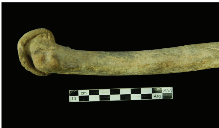
Figura 4. Patología. Epífisis distal del húmero derecho con osteoartrosis (osteofitosis periarticular)

Con respecto a la presencia de indicadores de estrés biomecánico, se observó evidencia únicamente en la epífisis distal del húmero derecho. Las superficies articulares de esta epífisis presentan, en su mayoría, labiación de grado leve, con excepción del epicóndilo lateral, donde la labiación es de grado moderado (figura 4). Se identificó exóstosis de nivel bajo en el peroné izquierdo y una marcada línea áspera del fémur derecho. El grado de desgaste dental es medio, correspondiendo al grado 3 de la escala propuesta por Molnar (1971). Presentó en todas las piezas relevadas (incisivos, caninos, premolares y molares) patrón cuspidal desaparecido con pequeñas áreas de dentina expuesta, dirección de desgaste perpendicular al eje dental y superficie oclusal aplanada. Se identificó presencia de labiación en el borde bucal de los alveolos de la dentición posterior. En la mandíbula, las mediciones de la distancia cemento-esmalte y el borde alveolar dieron un promedio de 2,4 mm, que corresponde a un grado de retracción alveolar leve según la escala propuesta por Brothwell (1987). Se registró leve depósito de tártaro en el 45% de los dientes relevados y ausencia de caries.