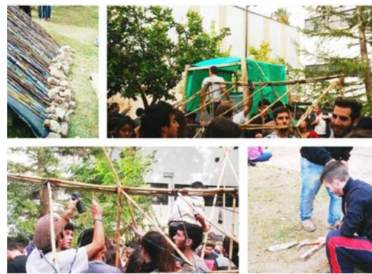
Figura 2. Juegos de simulación "Refugios"