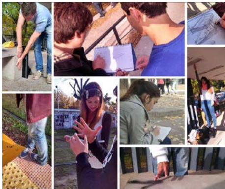
Figura 1. Relevamientos

Esto se logra mediante la investigación por parte del alumno, el estudio de textos, apuntes, folletos, documentación informatizada, y todo tipo de bibliografía, sumados a los trabajos de campo, las visitas, seguimientos de obras, relevamientos, juegos de simulación, investigación y extensión universitaria ( Figuras 1 y 2 ), con el fin de resolver la documentación constructiva de un ejemplo determinado, en relación a las condicionantes físicas, bioclimáticas, topográficas y contextuales asignadas. A través de la lectura y la investigación el alumno adquiere los conocimientos científico-técnicos necesarios que permitan generar respuestas a las preguntas como: ¿Qué es? ¿Cómo es? ¿Cómo se construye? ¿Cómo funciona? ¿Para qué sirve? ¿Cómo se relacionan entre sí?