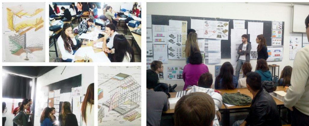
Figura 6. Resultados obtenidos. | Fuente: elaboración propia. 2015.

Como se puede observar en los resultados obtenidos, la evaluación comprende el proceso y el resultado: investigación, participación, intercambio, actividades de evaluación parcial, exposiciones, pregunta consultas, aportes al grupo, entregas parciales y finales ( Figura 6 ).