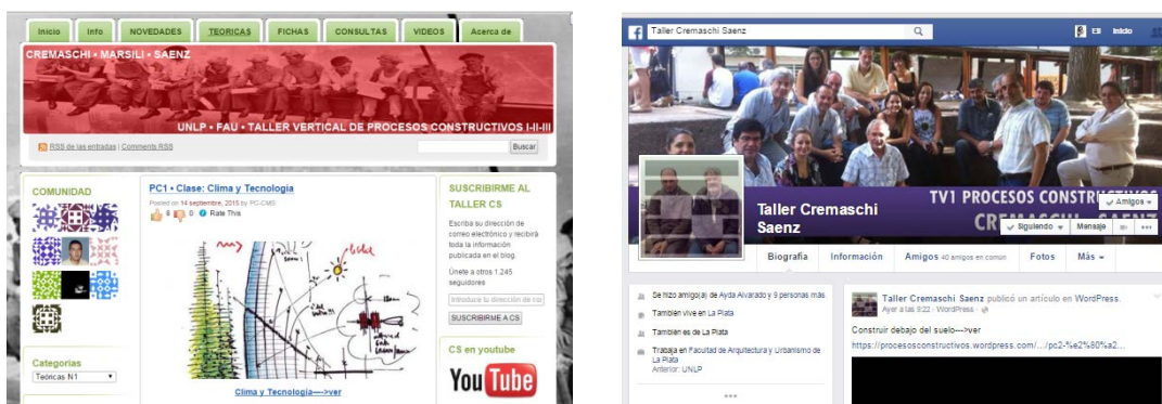
Figura 4. Redes sociales. | Fuente: elaboración propia. 2015.

Si bien la materia se dicta de forma teórico-práctica, es vertiginoso el cambio en las tecnologías de comunicación, lo que nos hizo pensar en la necesidad de generar espacios de contacto adicionales al horario del taller, entre los alumnos y el cuerpo docente, es por ello que se actualizan de manera constante los aportes de los medios informáticos, a través de nuestro blog: www.procesosconstructivos.wordpress.com y de nuestro facebook (Figura 4).