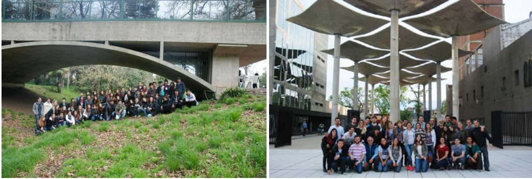
Figura 5. Viaje académicos Mar del Plata 2014-Santa Fe 2015.

de otras casas de estudios. Consideramos que estos viajes son de gran aporte y forman parte de nuestra metodología de enseñanza donde la seriedad en las acciones nada tiene que ver con la solemnidad y por el contrario dejan numerosas vivencias, experiencias y educación en responsabilidad y trabajo en grupo ( Figura 5 ).